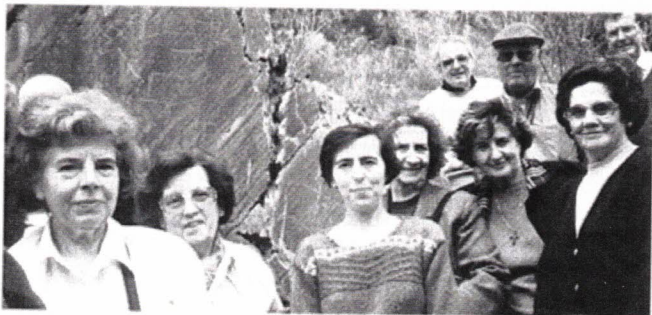
A Directora do Gabinete (ao centro) junto de uma das Gravuras

Daí ao Côa um guia acompanha o visitante a quem vai prestando os seus ensinamentos. Tivemos o privilégio de ser a própria Directora do Gabinete, a quem muito agradecemos, a guia sabedora que nos acompanhou.