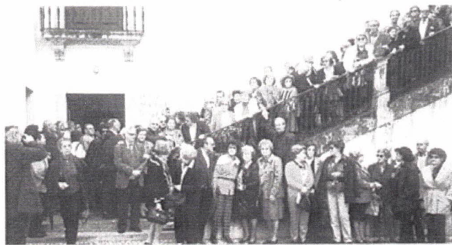
Parte do Grupo junto da "Galeria Manuel Filipe"

No próprio edifício da Câmara pudemos também visitar e admirar a Galeria Manuel Filipe .