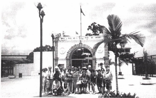
As bandeiras Portuguesa e Chinesa nas Portas do Cerco

“Minhas senhoras, aconselha-se uma visita àquela joalheria, para comprar peças de jade da Birmânia, garantidas, embora também as haja da China, mas não são tão valiosas, e peças de ouro e cloisonés, que só há aqui!... Olhem que em Portugal não se encontram!... São únicas!...”