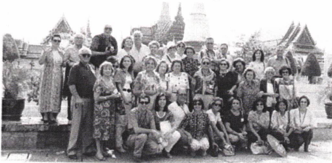
Um grupo num dos Templos

primeiro dia, três - o de mármore, a que assim chamam por de branco estar pintado, o do buda deitado, com 46 metros de comprimento e 15 de altura, e o do buda de ouro, de 18 quilates, que pesa cinco toneladas e meia - e, no último dia, que foi o da nossa partida para Singapura, aquele a que chamam do Buda de Esmeralda, que não é de esmeralda, mas de uma única pedra de jade, e que é o templo mais belo que eu já vi nesta minha vida, desde que me conheço como gente.