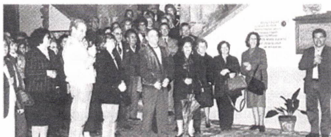
A assistência a aplaudir o conjunto musical

O programa indicava para esse primeiro dia uma visita a Celorico da Beira, Pinhel e Trancoso. Destaco a recepção calorosa que tivemos nos Paços do Concelho de Pinhel , um bonito solar do séc. XVIII que foi pertença dos "Antas e Menezes". Saudou-nos, logo à entrada, um bom conjunto musical.