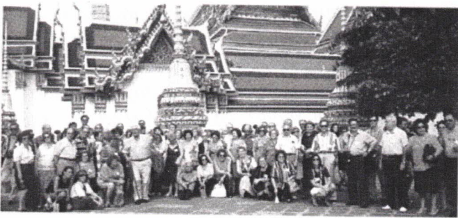
O grupo maior noutro Templo

Nos dias de nossa peregrinação por terras de El-rei Rama IX, nos fomos em visitas também ao real palácio de verão, que fica em Bang Pa-In , a mais de 10 léguas da capital, depois do que, embarcando-nos em pequenas náos mais parecidas com jurupangos, fomos pelo rio Chao Phraya a cima, com tempos bonanças, até uma povoação pequena, onde houvera, no séc. XVI, uma feytoria portuguesa, perto da defunta capital, como visto: