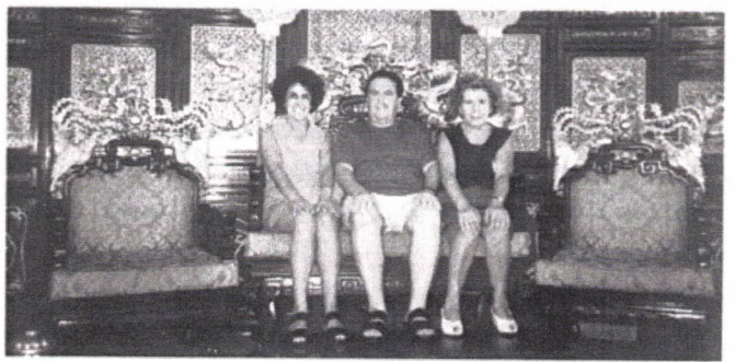
As A.A.E.C. da Madeira (ao centro), de Coimbra (à direita) e de Lisboa (à esquerda), pontificando no Jumbo Restaurant

Despois então, tomando uma não daquele senhor de que já vos falei e que dizem que tem muytas mais e muytos outros negócios por ali e por outras províncias e reynos, incluindo o nosso, e não havendo noticia de tífón que já por lá houvera passado, fazendo muytos estragos, navegámos té onde está Macau, adonde aportámos, a horas de vésperas, no moderno terminal inaugurado no ano de 1993, com uma área coberta de 60.000m quadrados, que pode suportar um afluxo anual de 30 milhões de forasteiros.