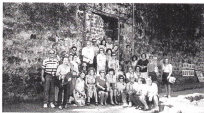
Portugueses nas Portas de Sant'Iago

Chegando depois té junto do lugar onde se ergueu A Famosa dita, cuja só resta a Porta de Sant'Iago e, subindo ao alto do morro, nos detivemos nas ruínas da Igreja de São Paulo , que tem muita estória, sendo que ali observámos, com muito respeito e devoçam, o lugar onde esteve sepultado, entre Março e Dezembro de 1553, mês em que foi trasladado definitivamente para Goa , o corpo de S. Francisco Xavier , depois que veio da ilha de Sancien , na China , onde morreu, em Dezembro de 1552. E daqui mais não vos direi, por evitar prolixidade e não me deter em particularidades que seriam muito largas de contar.