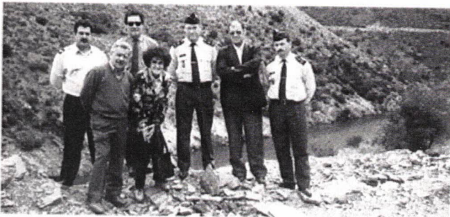
O Governador Civil da Guarda e os "auxiliares" da visita às Gravuras

sempre durante todo o passeio, foi de grande valimento. Se não fôsse a sua acção junto da G.N.R., a visita às gravuras não poderia ser proporcionada a tantas pessoas. A visita não é possível, por agora, a tão numeroso grupo como era o nosso, pelo que alguns tiveram de ser eliminados por sorteio.