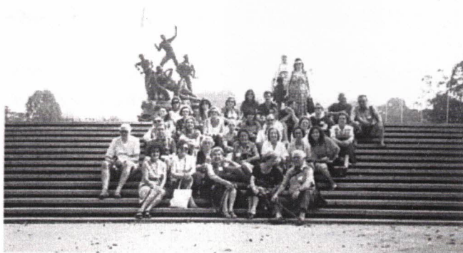
Parte do grupo junto ao Monumento da Independência

Nesta cidade, tivemos um banquete de muitas comidas, ao modo malayo, festejado com charamelas, trombetas e atabales e com músicas de boas falas à malaya, com doçainas e violas d'arco, que faria a muitos, nos tempos antigos, meter o dedo na boca em sinal de grandíssimo espanto.