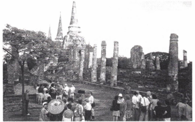
Por entre as ruínas de Ayuthaya

Durante a estadia na cidade que é hoje a capital, cuja fora antes Ayuthaya , arrasada pelos birmanes em 1767, depois destes gentios a cercarem prolongadamente, e que depois os siameses não voltaram a reconstruir,