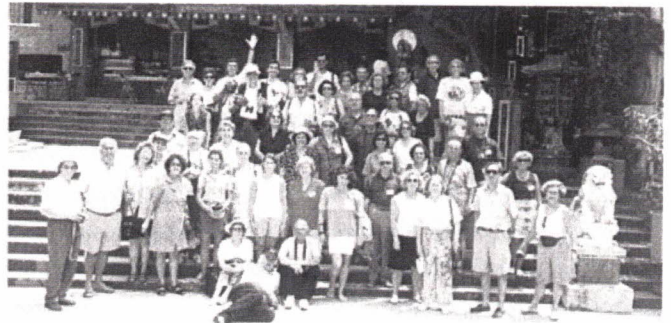
Honrando a Deusa, em Repulse Bay

com sedas, vestidos e fazendas da China e outros atavios muy vários, que por lá abundam, deixando ali mais aliviadas as nossas bolsas dos pardaos, cruzados, ducados e reais, com que, para tal, cada um de nós se havia provido.