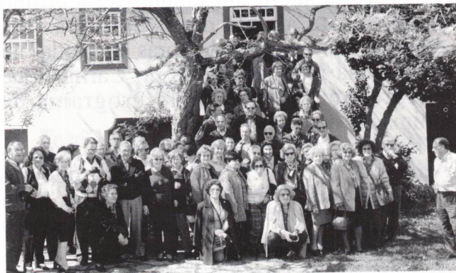
A visita à Casa-Museu Camilo Castelo Branco

A visita à Casa-Museu Camilo Castelo Branco era a grande atracção do dia.