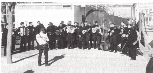
A "Estudantina" na rua