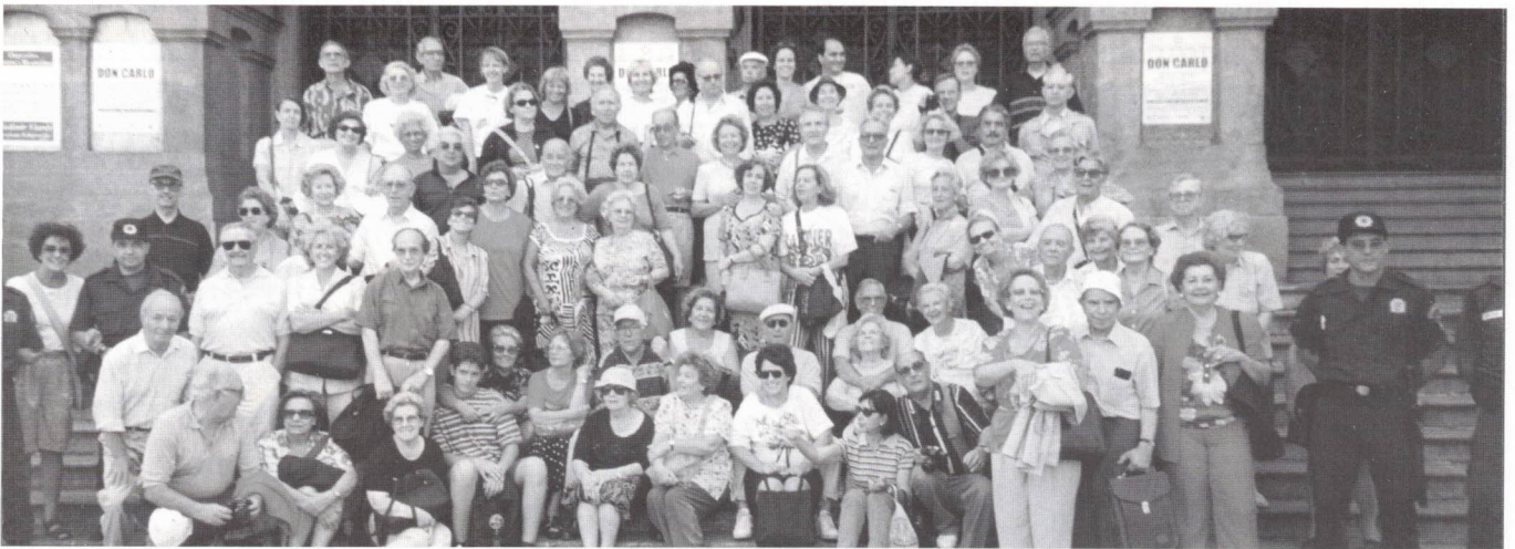
No Teatro do Rio, com os 4 polícias que nos “protegeram” durante a visita ao Centro Histórico.