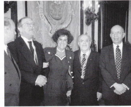
A Presidente da Direcção da nossa Associação com os medalhados (Goes e Brojo) e os Magníficos Reitores (actual e ex...)

(Coimbra, na "Sereia", no "10 de Junho" de '94, tinha já sido para o Goes o palco de uma distinção a nível nacional: a condecoração com o Grau de Grande Oficial da Ordem do Infante D. Henrique).