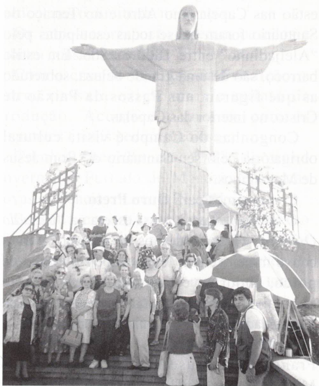
Corcovado - o Cristo Redentor

É obrigatória a visita ao Corcovado , ao Cristo Redentor.