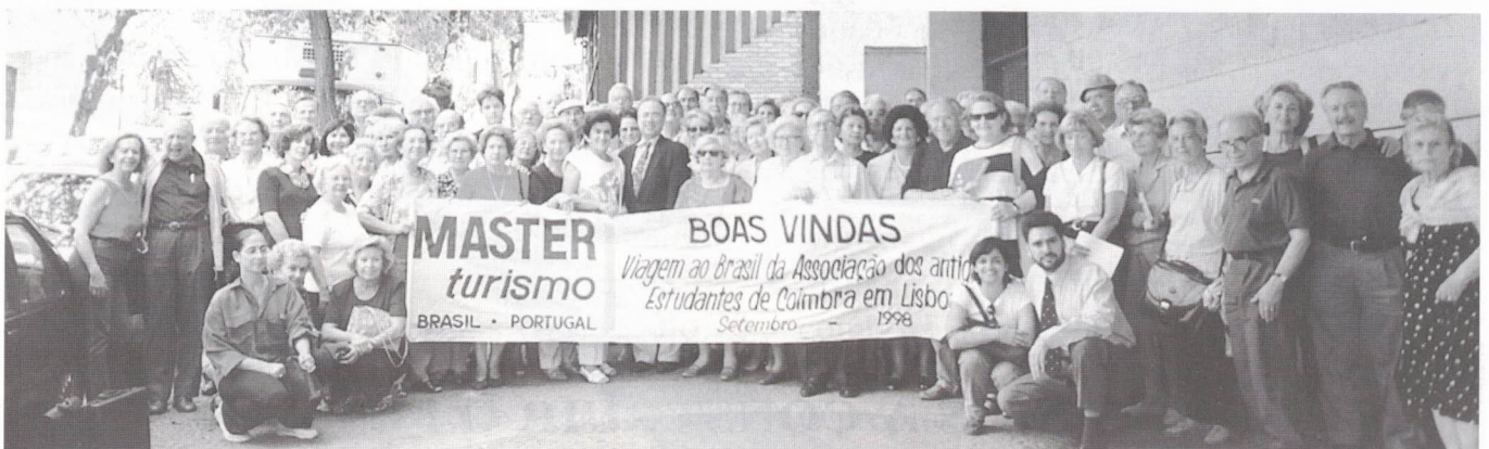
A alegria dos participantes em Belo Horizonte com o Cônsul ao centro.