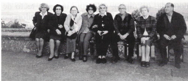
Vila Nova de Cerveira - Monte da Pena

Igualmente em Vila Nova de Cerveira não desperdiçámos a subida ao Monte da Pena. Do seu miradouro a vista é das mais deslumbrantes que o Minho nos oferece.