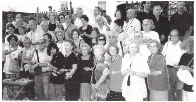
São Salvador - Igreja do Bonfim

O Convento de São Francisco, com a sua famosa igreja barroca, chamada a Igreja do Ouro, é uma maravilha revestida de azulejos oferecidos pelo rei de Portugal em 1730.