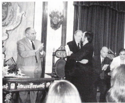
O abraço do orador ao medalhado