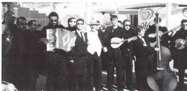
A "Estudantina" e o Vitorino