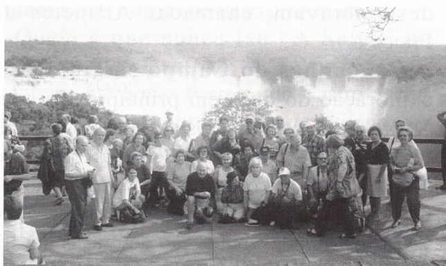
As Cataratas do Rio Iguaçu

O Parque Nacional e as Cataratas são paisagens das mais espectaculares do Universo. Com oitenta e dois metros de altura e quatro quilómetros de largo, separando a Argentina do Brasil, as Cataratas causam um forte impacto no visitante. Tivemos a felicidade de as observarmos com um descomunal volume de água como há muitos anos não acontecia.