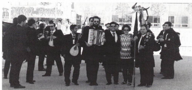
A "Estudantina" com a sua Madrinha (e nossa presidente...)