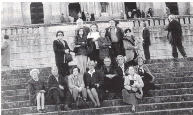
Viana do Castelo - Alto de Santa Luzia: Templo do Sagrado Coração

Passando por Caminha, chegámos a Viana do Castelo, onde fizemos uma pequena paragem no Alto de Santa Luzia para visitar a Igreja e observar a paisagem à sua volta.