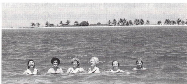
Ilha de Itaparica - o mar convidava a um banho

Em São Salvador o programa da viagem incluía uma excursão pela Bahia de Todos os Santos em direcção à Ilha de Itaparica. Uma hora aproximadamente foi o tempo que o barco demorou na travessia. O dia estava lindo e o mar convidava a um banho.