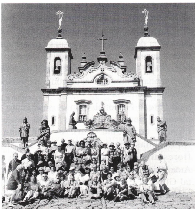
Congonhas do Campo - Santuário do Bom Jesus de Matosinhos