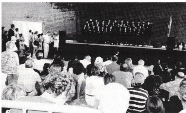
“ Orfeon Académico de Coimbra ” mostrando o seu virtuosismo