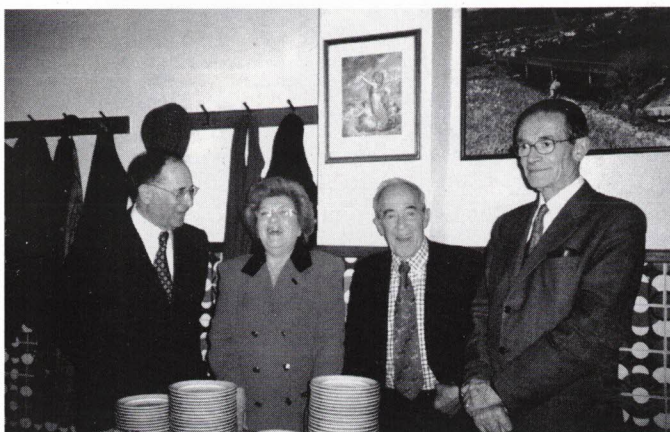
Aniversariantes de Maio.