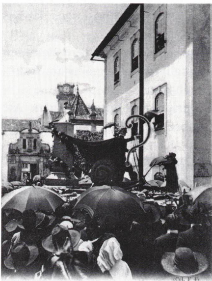
O cortejo do "Enterro do Grau" (1905), à saída do Largo da Porta Férrea.

É que a "limpeza" ultrapassou de longe as casas "da porcaria e mau cheiro" e estendeu-se a coisas muito belas - Alameda de Camões com o seu monumento, o já citado Largo da Feira, o Instituto de Antropologia