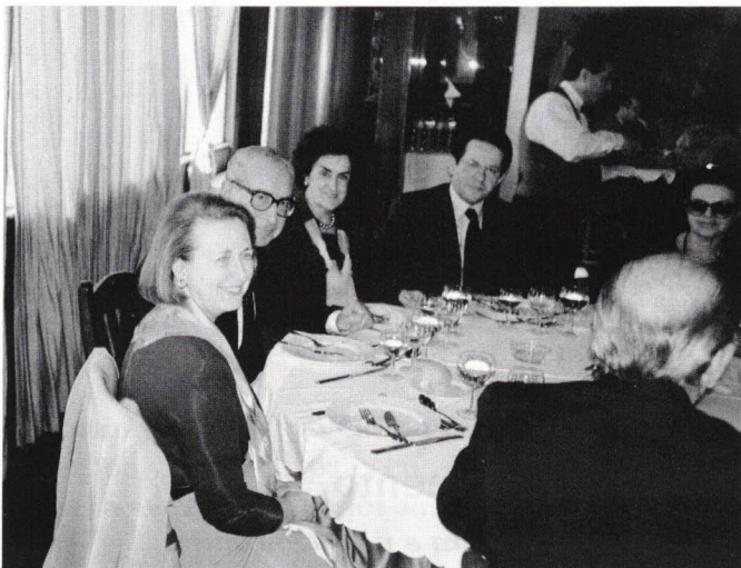
As “Presidências” com o casal Constâncio.