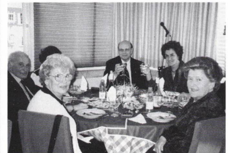
Com o anfitrião Director da AFAP