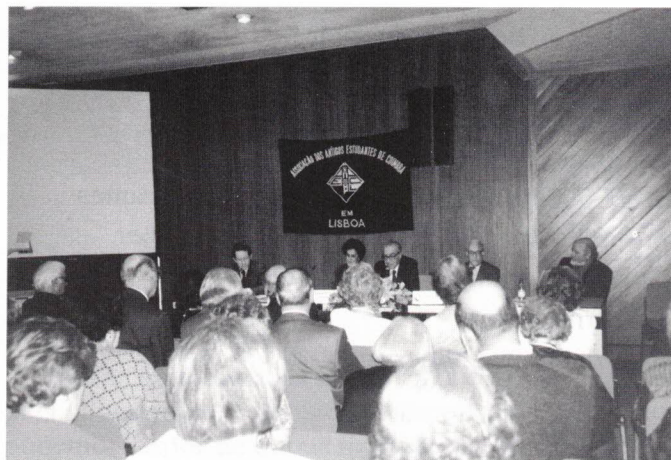
O Presidente da Assembleia Geral agradece.