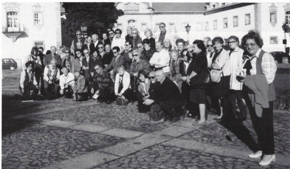
Parte do Grupo em Lamego.