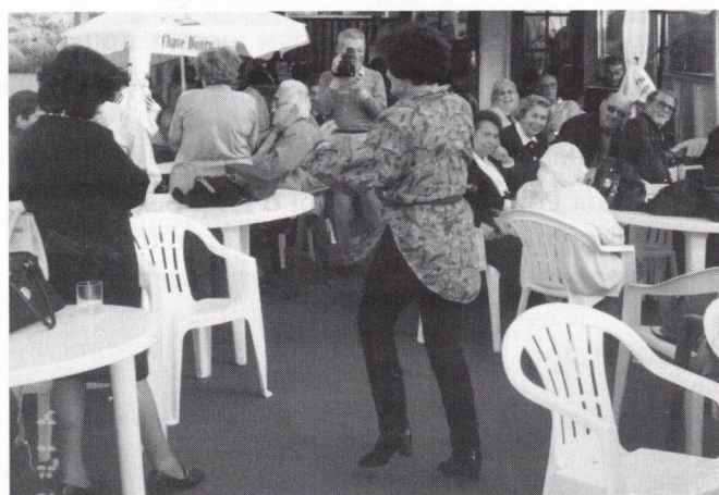
O “salero” da “Presidenta”.

A nossa “Presidenta” não “resistia” aos primeiros passos de dança, ao som dos primeiros acordes.