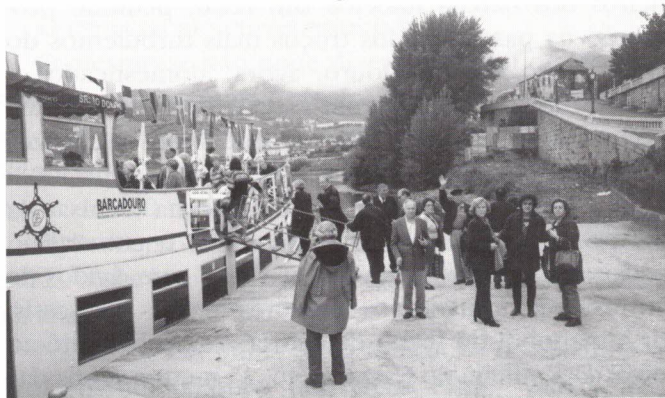
O embarque na Régua.

Eis-nos de regresso ao cais onde o “nosso” “Senhora do Douro” nos aguardava desde a véspera.