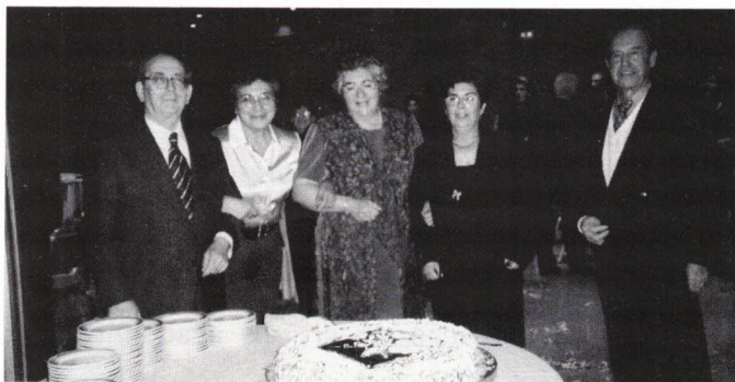
Aniversariantes de Fevereiro (com um bolo de verdade...).

E... para os aniversariantes desse mês presentes, a partida que esperam... mas não reconhecem, porque mudou de aspecto e conseguiu enganá-los: um monumental bolo de batata (não doce)! Eis o "manganão":