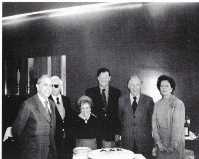
Aniversariantes de Março.