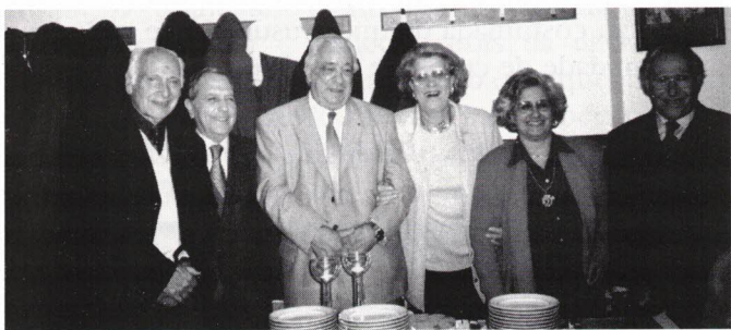
Aniversariantes de Março.

E, como é habitual e esperado, o bolo de aniversário para os aniversariantes desse mês presentes e os parabéns a vocês para todos os outros (cujos nomes são religiosamente lidos). Aqui estão eles: