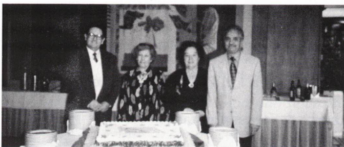
Aniversariantes de Abril.