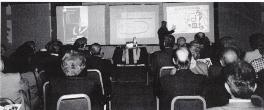
A conferência em audio-visual.