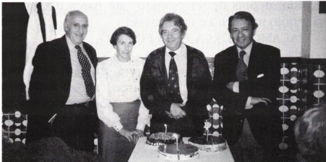
Aniversariantes de Novembro.

Com castanhas e jeropiga, festejámos animadamente o S. Martinho no dia 6 de Novembro do ano findo.