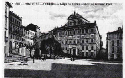
O fabuloso Largo da Feira, Edifício do Colégio dos Loios e Rua dos Loios.

todos lembrei, certamente, os melhores anos da sua juventude!