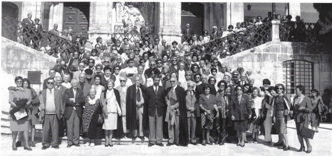
Registo para a posteridade