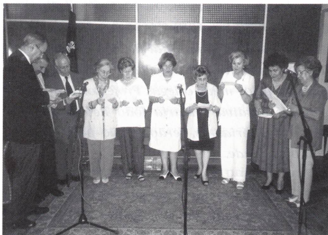
O nosso coral AD-HOC

Se este grupo continuar a ensaiar, com a mesma regularidade, sob a batuta do Anjos de Carvalho - e assim já acreditamos que "anjos da casa façam milagres"-, vamos ter um coral que passará a ser um cartão de visita da nossa Associação.