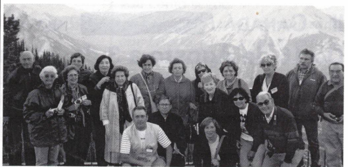
Banf - miradouro na Montanha Sulfurosa

tanha Sulfurosa (accedida por teleférico a 2.200 m).