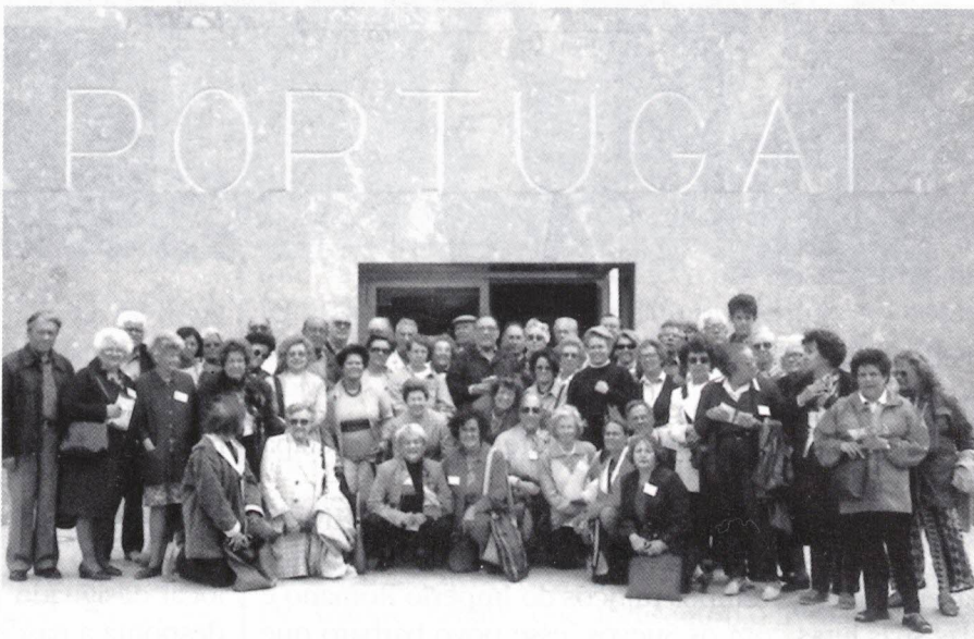
Hannover - Expo 2000 - Pavilhão de Portugal

mos a um espectáculo nocturno de muito boa qualidade. Numa outra noite metemo-nos, qual bando de adolescentes, no Metropolitano, sem guia, estudando e discutindo itinerários.