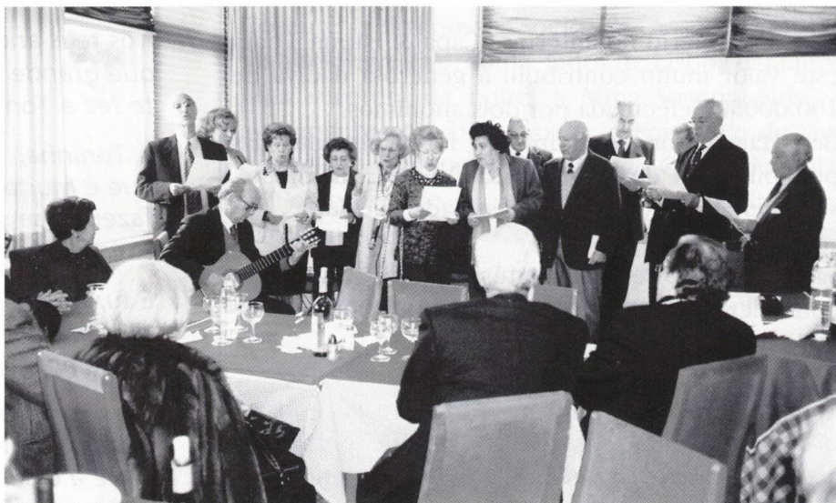
O Coral em pleno

O almoço estava óptimo e a conversação amena. No final exibiu-se o Grupo Coral AD-HOC .