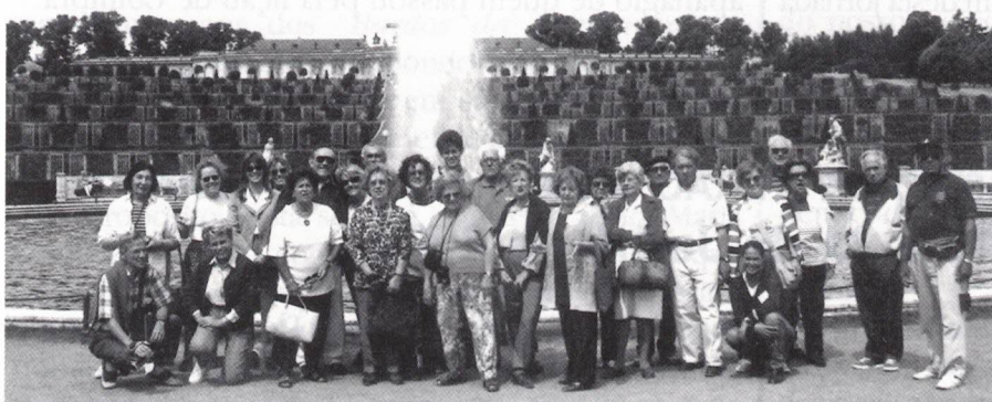
Palácio e Jardins de Sanssouci

Fizemos o Cruzeiro das Mil Ilhas no Lago do rio Havel, cujas margens nos maravilharam e que nos deu ensejo de ver de perto a célebre Ponte dos Espiões . Passeámos por Potsdam e, depois da visita ao Palácio de Sanssouci , percorremos os seus parques e jardins.