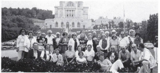
Oratório de S. José

- Montreal - já menos característica, mas muito desenvolvida, com o seu “ Beijódromo ” no Mont