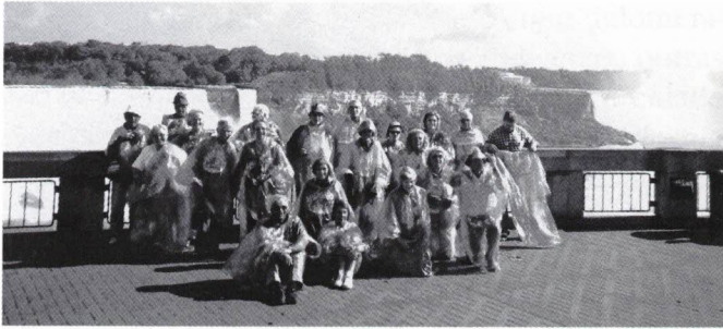
Cataratas de Niagara

ambas as cataratas: a canadiana e a americana, separadas por território americano, e aventurando-nos num tour de barco em plenas Cataratas que mais parecia um chuveiro, como a foto desvenda: