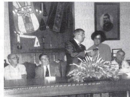
Lar da Misericórdia de Arganil (troca de galhardetes)