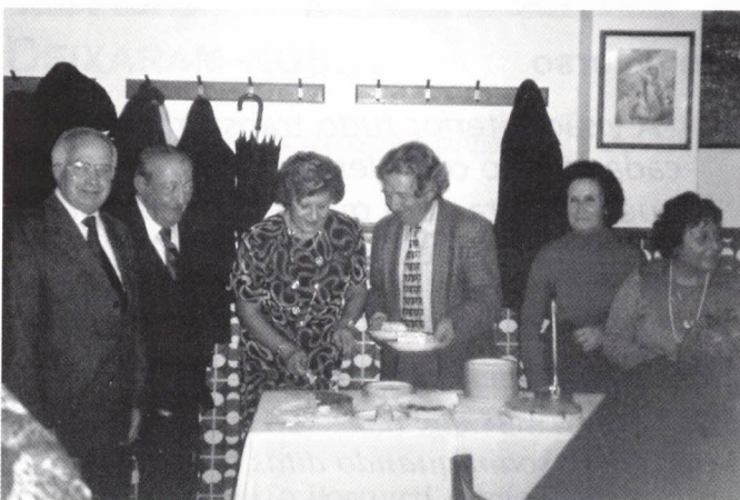
Aniversariantes de Novembro e Dezembro

valho e outros voluntários "à força" animam os seus "fans" com as suas belas violas e guitarras, até lhes doerem as unhas!