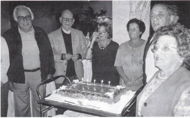
Aniversariantes de Setembro/Outubro

O dia não estava, porém, concluído pois, terminado o jantar, todos se dirigiram à romântica Lapa dos Esteios , agora muito alindada, para se assistir a um erudito momento de lazer.