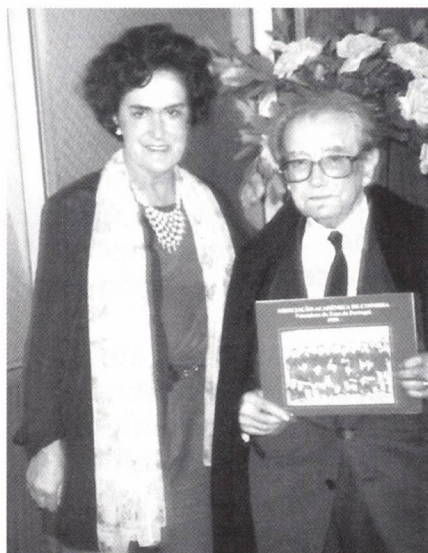
O Homenageado e a Presidente