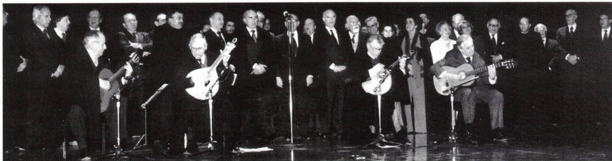
A apoteose da "Saudade"