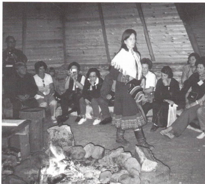
A iniciação Lapónica

No dia seguinte, lá continuámos o nosso "Salmão Connection" rumo à Letónia com levantamento de Rancho e tudo. A sua capital, Rija , "a Paris do Báltico", deslumbrou-nos com os seus edifícios "art nouveau". Retornando pelos próprios passos, atravessámos o Mar Báltico, num ferry cosmopolita e entre milhares de ilhas encantadas, até à Finlândia, onde apanhámos o avião para a Lapónia , aterrando em Rovaniemi, pisando o histórico " Circle Artikum " e visitando a lendária Aldeia do Pai Natal, onde todos voltámos à meninice. Entrámos então na "Rena Connection" onde o grupo, ungido por uma indígena, numa cerimónia de iniciação Lapónica, se transformou no Grupo dos 4 Ventos .