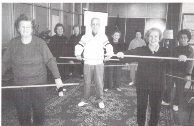
A "juventude" em plena forma