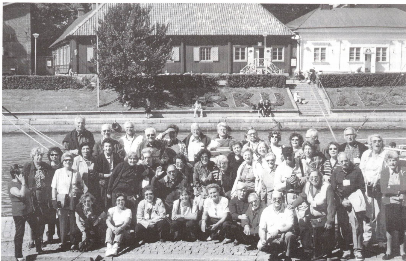
junto ao rio Aura

No dia 4 de Agosto, lá partimos no voo LH3029 com destino a Lisboa cheios de saudades, apesar de alguns precalços. Aí chegados, cada um seguiu seu destino.