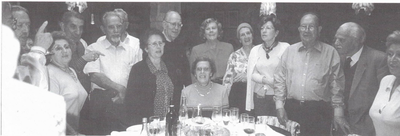
Os parabéns a você