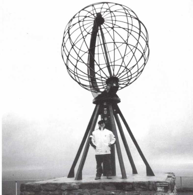
Cabo Norte – o "dono" do Globo

porém a fortuna foi ingrata: pepitas nada! Cabisbaixos, lá apanhámos o avião para Helsínquia , Filha do Báltico, com a sua neoclássica Praça do Senado, a Tempeliuukio escavada em rocha sólida, monumento a Sibelius, entre outras.