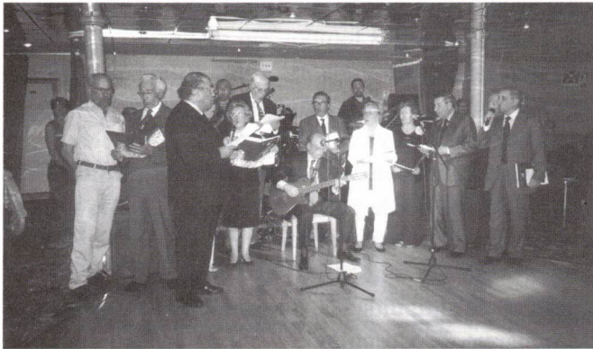
Alguns dos nossos "navegadores" em actuação

Vita " nos proporcionou compreende também a variada e excelente alimentação servida a bordo, sem esquecer os momentos de diversão e entretenimento que nos eram proporcionados, especialmente à noite, no salão de festas. De todos esses momentos, haverá que sublinhar a participação de alguns elementos do nosso grupo na denominada " Noite do Passageiro ", com realce para o momento de poesia, a actuação do nosso grupo coral " Ad-Hoc " e a mostra de Fado de Coimbra, actuação que no seu conjunto mereceu o aplauso de todos os passageiros presentes, que enchiam o Salão de Festas.