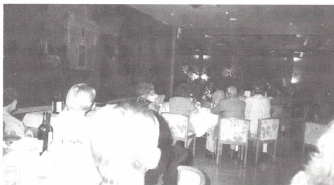
Um pequeno apontamento visual...

Dezanove meses volvidos, podemos constatar que, de um modo geral, a República da China soube respeitar o princípio "um país, dois sistemas", salvaguardando a singularidade de Macau, embora com alguns visíveis recuos e desvios, justificáveis ainda pela procura de caminhos e pelo ajustamento de objectivos nesta nova fase da vida de Macau. Oxalá não falte lucidez e determinação aos governantes para fazerem cumprir tudo o que foi garantido à população de Macau e eles saibam corresponder às enormes expectativas que, ao lado de muitas ansiedades e interrogações, marcaram o arranque de mais esta experiência política que todos, em Macau, querem que seja bem sucedida."