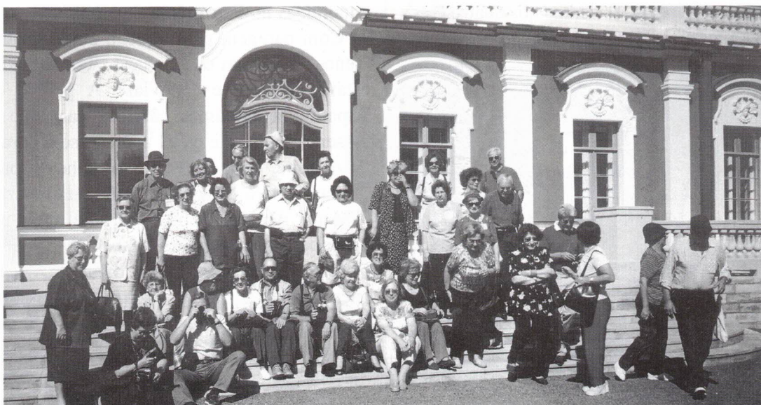
O Palácio de Kadriorg

A conhecida "Pequena Praga" é, na realidade, linda com as suas construções medievais dentro da muralha da cidade velha. Quem não se recorda da Catedral de Domsy, o Palácio de Kadriorg entre outras!