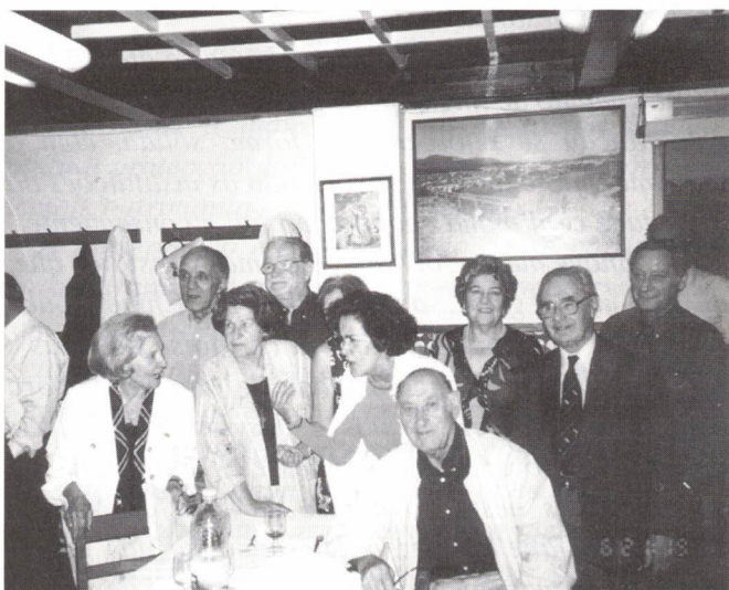
Aniversariantes de Junho e Julho

Aí são lembrados, sempre, os aniversariantes do mês a quem é oferecido o Bolo que cortam e distribuem por todos os presentes. Os "parabéns a você" não são mais que uma comunhão com a festa dos que vêm passar mais um ano, num ambiente bem coimbrão.