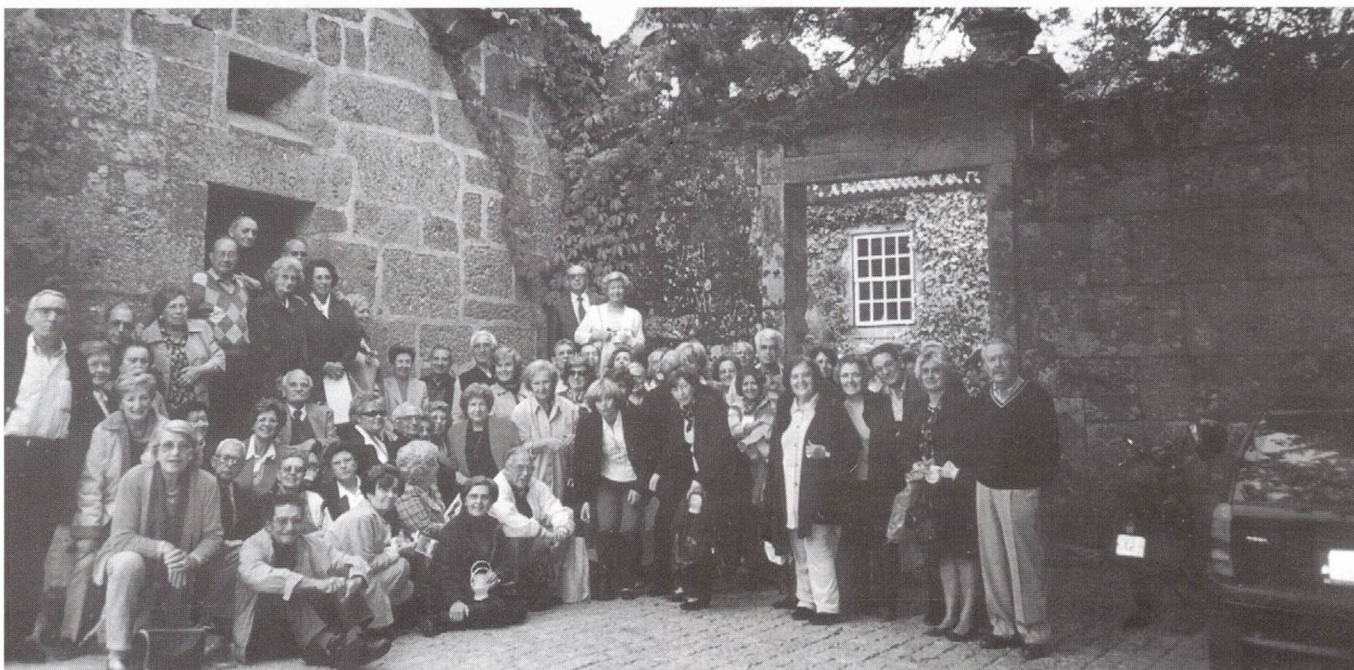
Casa-Museu Eça de Queirós

Foi-nos depois proporcionada uma visita guiada à Casa-Museu.