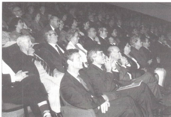
A assistência atenta