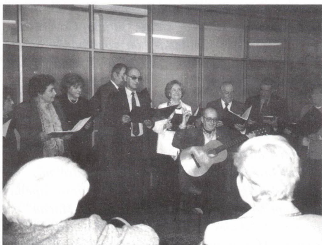
O virtuosismo dos "jovens"