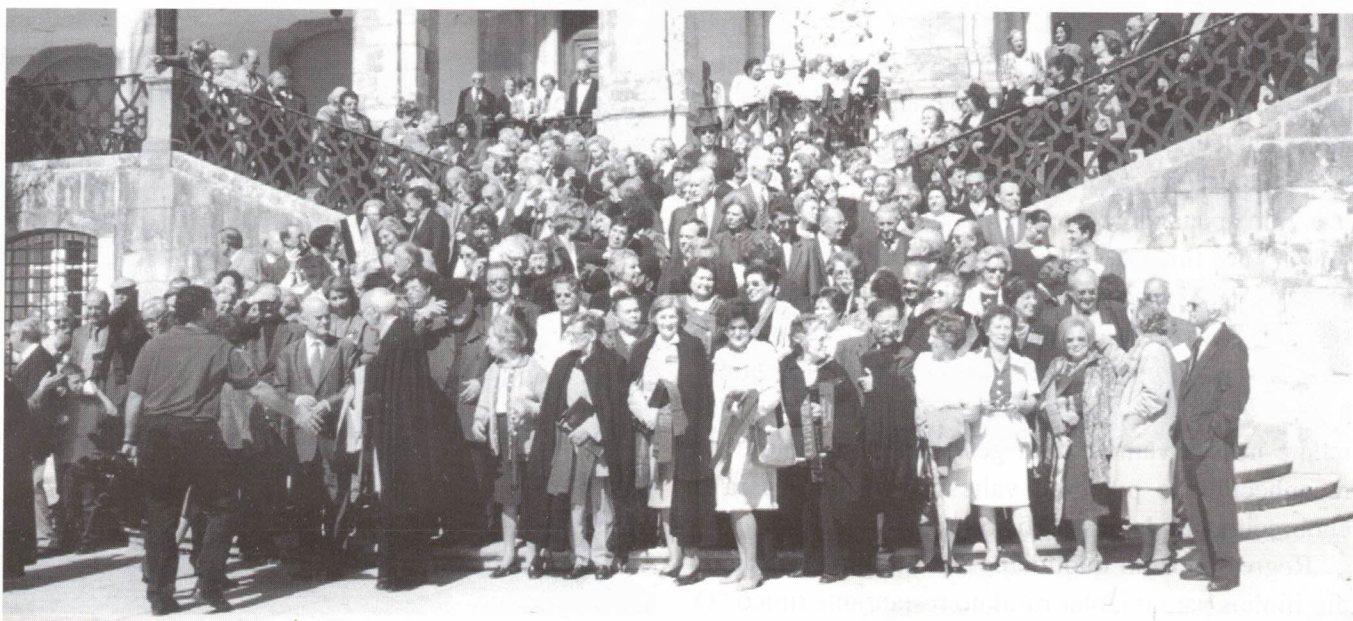
As várias Associações dos Antigos Estudantes

brou-se Missa na Capela da Universidade, a que se seguiram os cumprimentos ao Magnífico Reitor, a Oração de Sapiência e a fotografia da praxe na Via Latina.