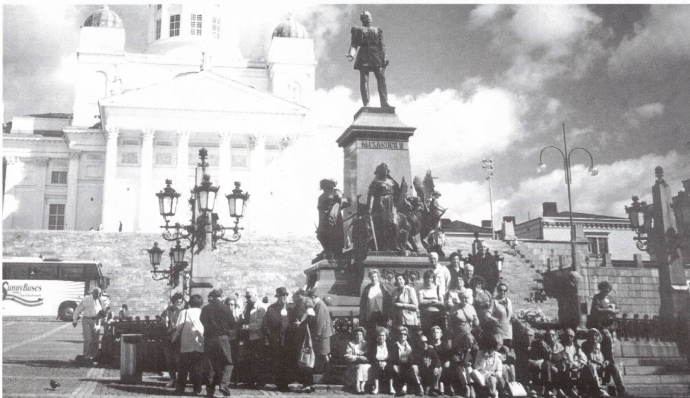
Praça do Senado

Na véspera da partida, lá nos aguardava Turku com o seu castelo e o seu Luostarinmäki, com as 18 casinhas de madeira de há 200 anos (museu ao ar livre) e a cidade subterrânea da Idade Média, Aboa Vetus .