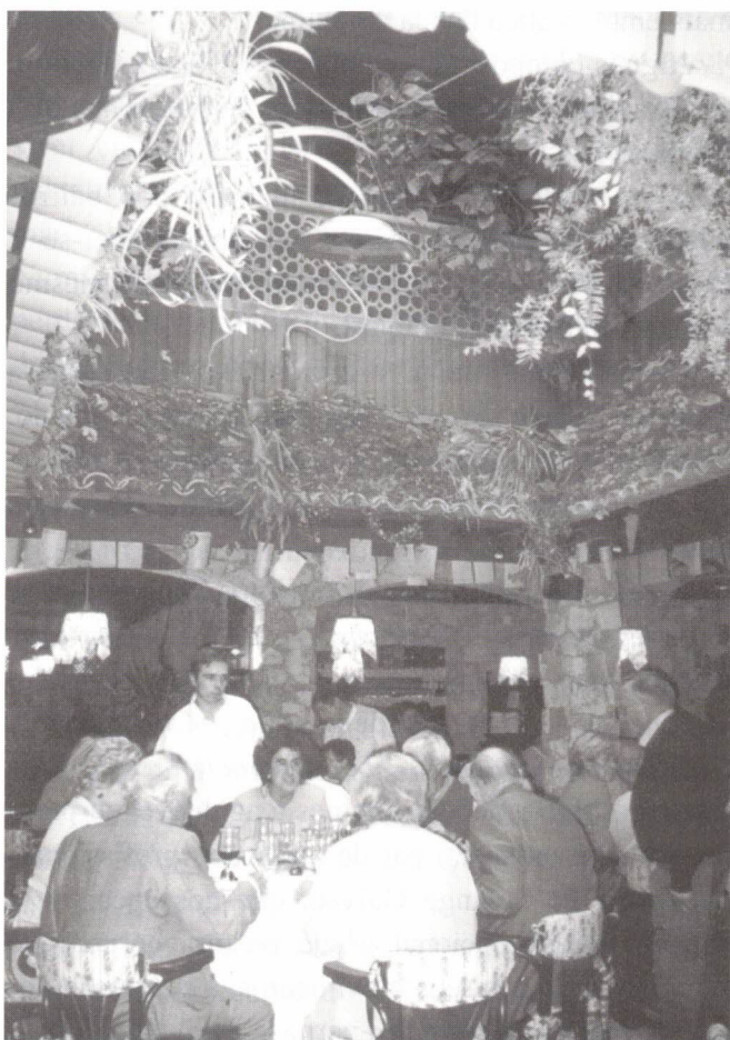
O convívio à mesa

Já estávamos avisados, pois não era a nossa primeira vez. Mas a juventude é assim: ninguém resistiu a comer muito.