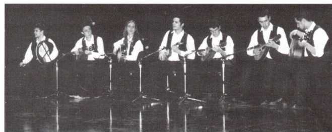
O "Grupo de Cordas" em actuação

Foi a vez da refrescante exibição do aplaudidíssimo "Grupo de Cordas".