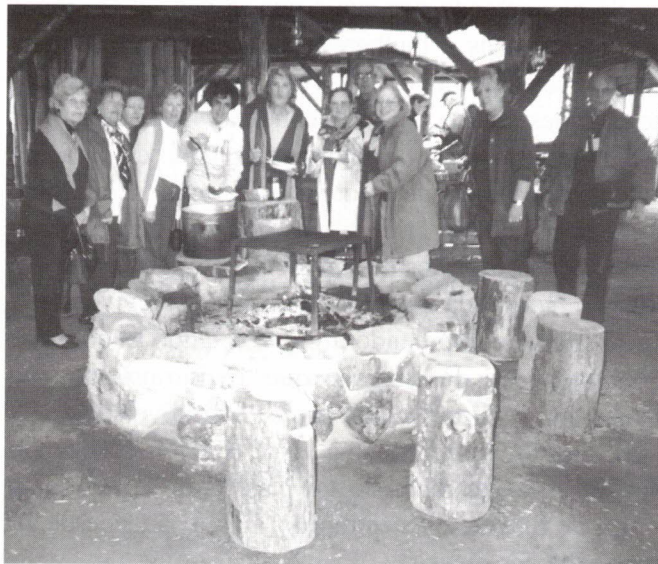
Self-Service à moda da Lapónia

A caminho, em bolandas, havia paragens para xixi e incursão pelas lojinhas para compras, passando Särasto e Kittila . É verdade, ia-me esquecendo de dizer que o grupo tinha bom apetite. Desgraçado de quem não chegasse a horas! Entre empurrões e disputas para assegurar os melhores lugares, lá "saboreavam" tudo.