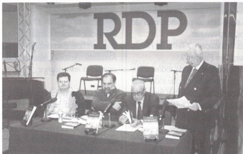
O Poeta e os seus apresentadores