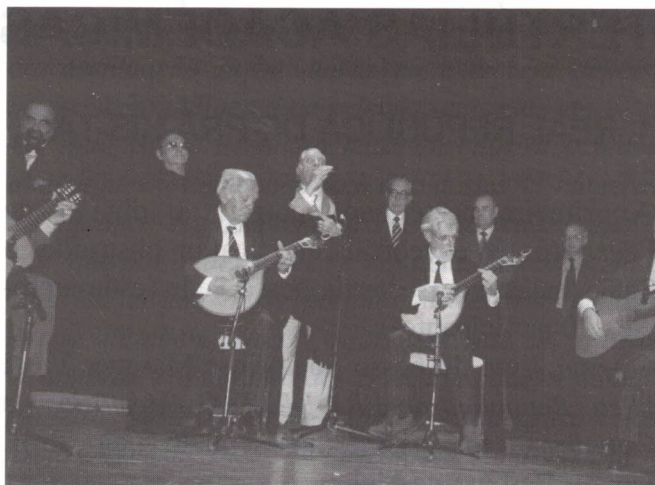
O Grupo "Porta Férrea"

No final, cantores da canção goesa e da coimbrã entoaram, em unísono, algumas canções, numa simbiose inédita, reveladora da solidariedade (também musical) que nos unia a todos, tendo o "Grupo Porta Férrea" oferecido aos presentes a esperada Serenata de Coimbra .