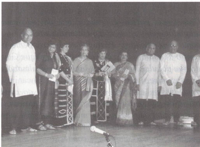
O Grupo EKVÁT

Depois, além do condimento gastronómico, outros de cariz cultural, artístico e recreativo compuseram um Sarau aplaudido pelos 165 presentes: começando pelo duplamente apropriado "Auto da Índia", de Gil Vicente, representado por alunos da Escola Profissional de Teatro de Cascais , com a arte de actores consagrados; seguindo-se uma exibição pelo Grupo EKVÁT da Casa de Goa , de cantares e danças das suas terras, com trajes típicos, passos, vozes e sons musicais que a todos