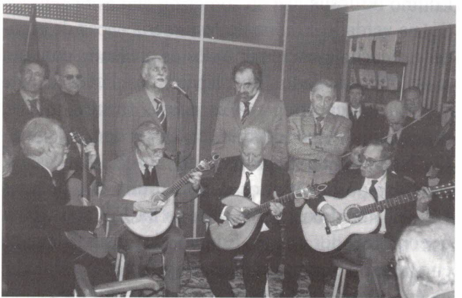
O Grupo "Porta Férrea"