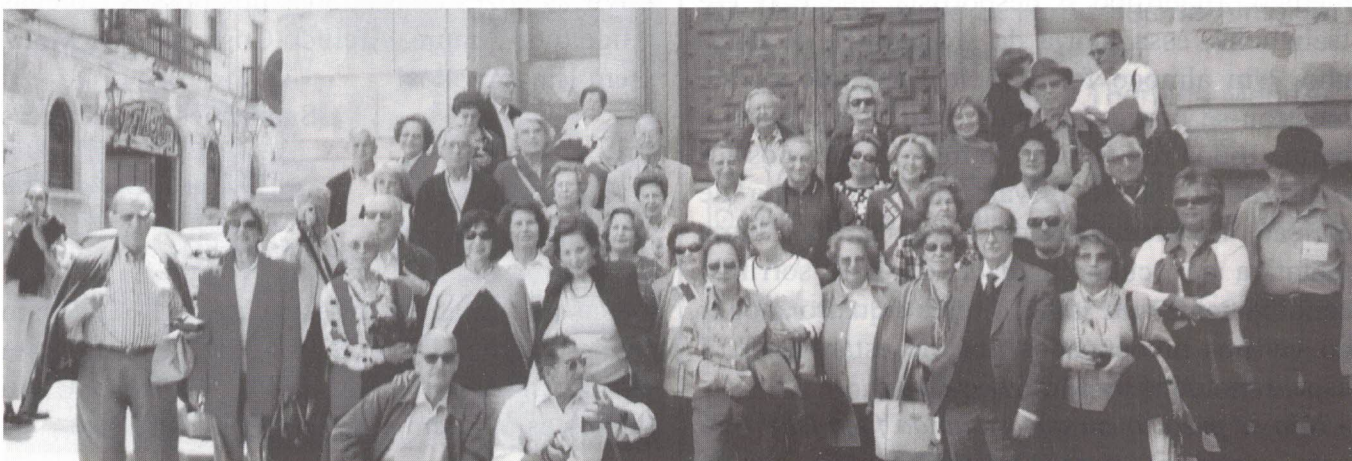
Na Universidade de Salamanca