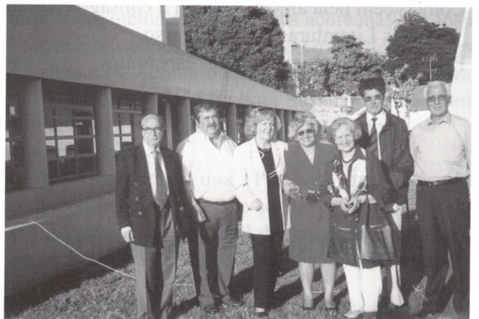
O Júri e os laureados