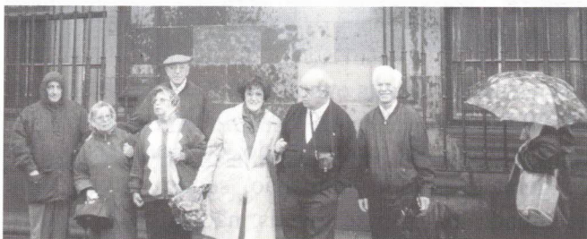
Alguns dos resistentes à chuva