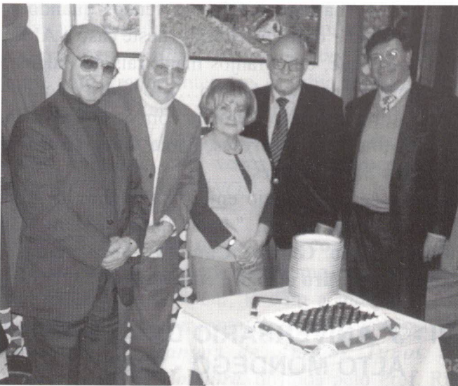
Aniversariantes de Março

Realizaram-se três, naquelas primeiras sextas feiras de cada mês (e nos meses em que não ocorria sobreposição com outras actividades) que todos aguardam com a certeza de desfrutarem de momentos culturais, de um convívio fraterno, de felicitações aos aniversariantes desse mês e, sempre que possível, de Serenata de Coimbra .