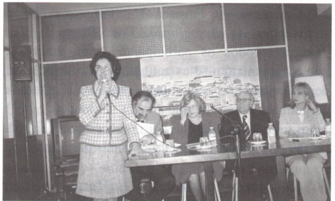
A abertura da sessão pela Presidente

Servindo por um belo texto, dentro de uma sábia arte de construir personagens e factos, este livro de Santos e Silva constitui-se em artefacto e em justificável pretexto para o lermos e viajarmos por esse Portugal fora entre o Mondego, o Douro e o Minho e nos revermos nas nossas próprias memórias."