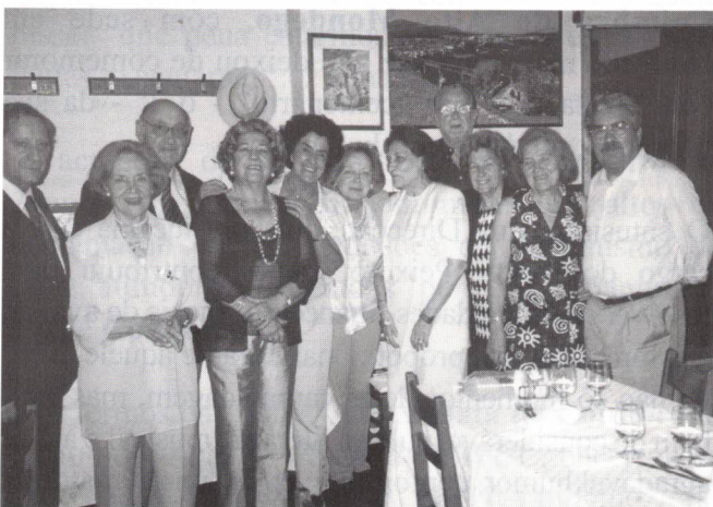
Aniversariantes de Junho e Julho