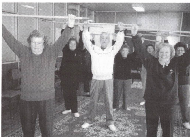
A Juventude em acção

Se quiseres juntar-te a este grupo, é só contactares nesse sentido a nossa Sede.