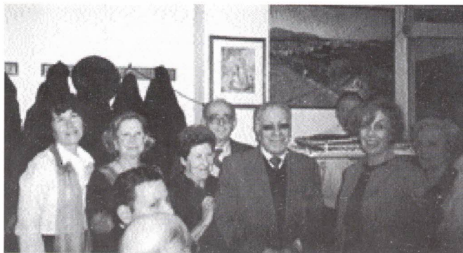
Aniversariantes de Fevereiro