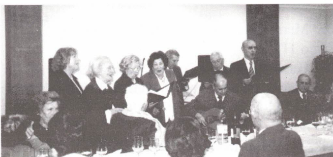
O Grupo Coral "Ad-Hoc" em actuação