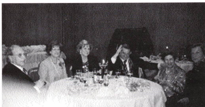
Os mais pacatos...