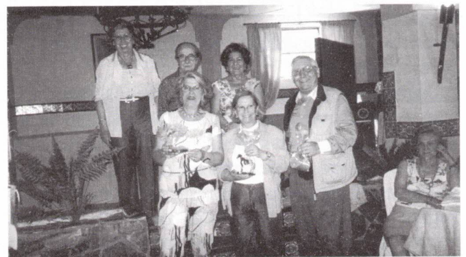
Entrega dos Prémios das quadras