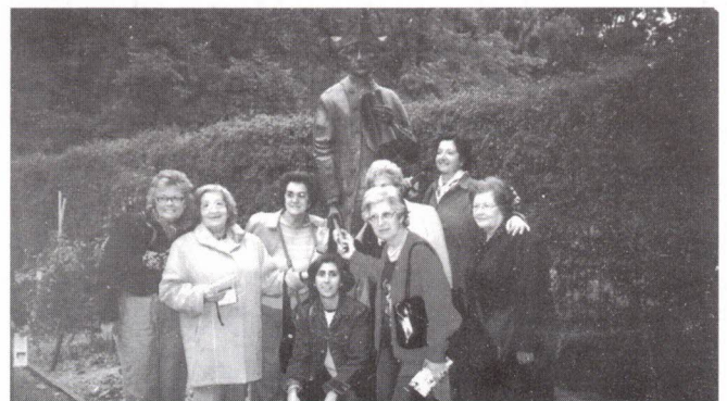
Estátua do Capitão James Cook

Passámos ainda pelo hall do Casino para assistir a um "espectáculo" de música, luz e água. Para terminar o dia e após "diplomáticas" negociações, subimos à Torre do Rialto , onde pudemos apreciar um panorama fantástico da cidade.