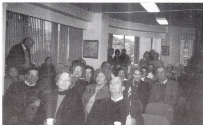
Parte de uma assistência interessada

Felizmente o contrário também ocorre, e o jornalismo surge como ofício nobre e vital, quando denuncia injustiças, atropelos, indignidades ou quando dá conta dos casos e histórias que contribuem para uma vida mais justa e mais solidária da comunidade. Os jornalistas são pessoas como as demais. Têm sonhos, ideias, crenças. Criam família, assumem encargos, não vivem em torres isoladas. Quando são sérios e conscientes da sua humana natureza, suportam ou convivem melhor com as pressões e condicionamentos permanentes ao seu trabalho. E temos, há que frisá-lo, em Portugal, jornalistas de imensa qualidade – humana e profissional – jornalistas que honram a sua classe e que são, nestes tempos mais turvos, bons exemplos para os camaradas mais novos.