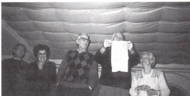
O aniversariante e o poeta

Que este imperfeito relato contribua para guardar na memória tão maravilhosa viagem.