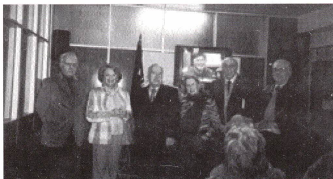
Júri e Premiados