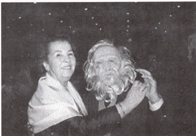
Adivinhem quem é?