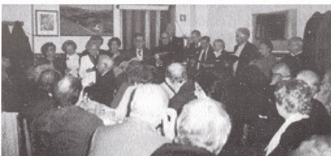
O Coral Ad-Hoc em homenagem