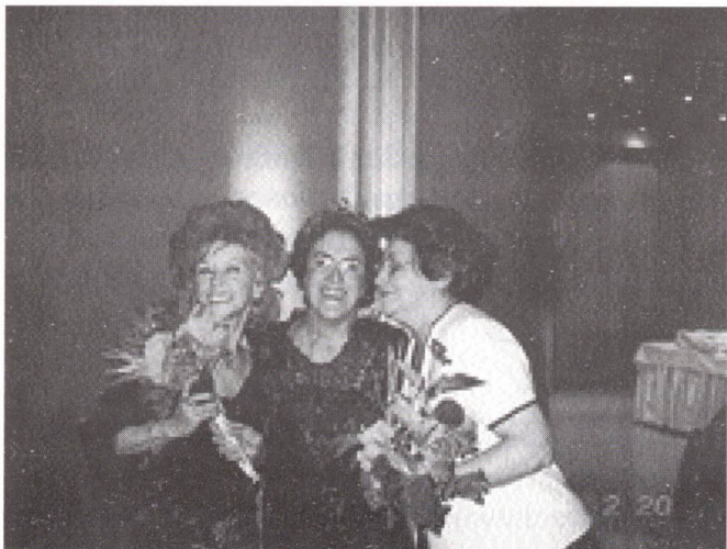
A Presidente oferece flores a 2 aniversariantes

E como todos esperam, o bolo de aniversário carnavalesco fez "cair" os aniversariantes: