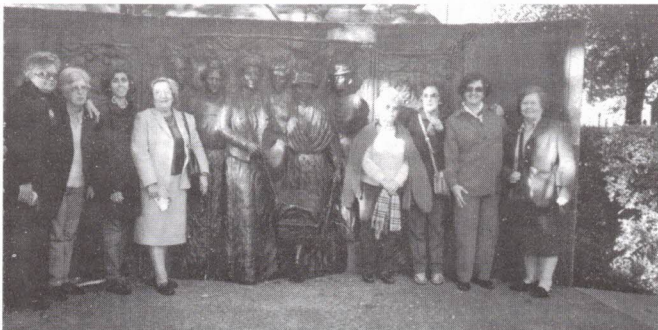
Monumento às primeiras sufragistas

O 21º dia de viagem foi dedicado à visita de Christchurch , a terceira cidade da Nova Zelândia, capital da região de Canterbury, cidade-jardim (dada a abundância de espaços verdes), tipicamente inglesa e muito conservadora. Visitámos a Catedral do Santíssimo Sacramento , católica, de estilo romano renascentista, que é a maior da (Australásia) Nova Zelândia. Todo o seu interior apresenta uma harmonia entre as naves espaçosas, os pilares com capitéis variados e a interacção de arcos graciosos. Seguimos para a Praça da Catedral, o centro activo da cidade. Na praça está uma estátua erigida a John Robert Godley, o inglês que organizou a viagem que trouxe os ingleses até aqui. Existem três monumentos na praça, sendo um dedicado aos mortos da II Guerra Mundial; outro a todos que chegaram à cidade e o último dedicado aos maoris, que representa um cálice em forma de palmeira com outras árvores nativas.