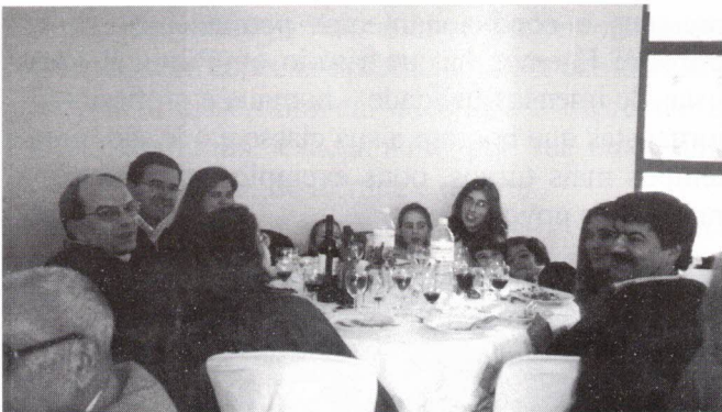
Os Madre Christo