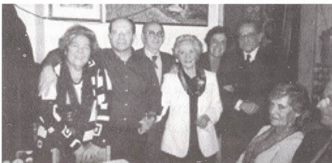
A Toninha e os outros membros da Direcção

Não faltam, claro, os habituais parabéns a todos os que fizeram anos nesse mês e o respectivo bolo que os aniversariantes presentes distribuem pelos Colegas, como se vê: