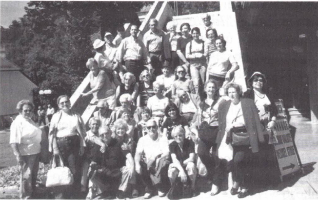
Rijeka – À saída das maravilhosas Grutas de Postojna (Eslovénia)

passeio e visita ao centro da cidade e ao castelo. Na manhã do dia seguinte, acompanhados de guia, visitámos os principais monumentos da cidade, passando pela Praça da Câmara Municipal, as 3 pontes, o mercado, a Biblioteca, a lindíssima Catedral