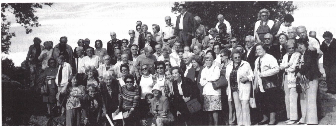
O Encantamento da Galafura