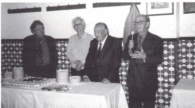
Aniversariantes de Outubro

Para grande satisfação de todos, houve a oportunidade de realização de um na primeira 6ª feira de cada mês deste semestre (com excepção de Agosto, claro); e, como sempre, com uma adesão que oscilou entre os 35 e os 44 convivas, que cantaram os parabéns aos aniversariantes presentes e ouviram a Serenata de Coimbra com a "religiosidade" que merece a disponibilidade incondicional do nosso "Grupo Porta Férrea".