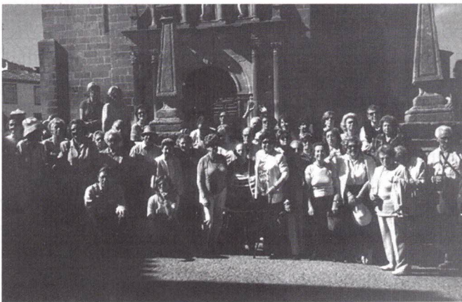
À porta da Igreja Matriz de Moncorvo

O seu primeiro Foral, foi-lhe atribuído em 12-5-1289. Passeando pela vila, apreciámos o seu centro histórico, com as suas várias casas brasonadas. No Largo dos Paços do Concelho, vimos a estrutura do antigo Castelo, mandado demolir no século XIX, e não podíamos deixar de visitar a Igreja Matriz. Monumento Nacional que começou a ser construído na primeira metade do séc. XVI e demorou cerca de 100 anos a ficar concluído.