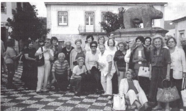
Porca de Murça

Após opíparo e saboroso almoço no restaurante "Meta dos Leitões", na Bairrada, continuámos a nossa viagem com uma primeira e curta paragem na Vila de Murça , já em Trás-os-Montes, onde tivemos oportunidade de contemplar a célebre "Porca de Murça", monumento de granito colocado na