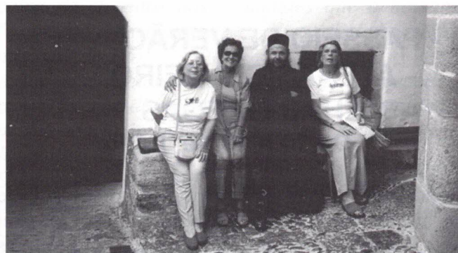
A Tentação de Patmos

setentrionais do Dodecaneso e foi nesta ilha que esteve exilado S. João, o Teólogo, que foi Apóstolo e Evangelista e aí escreveu o livro do Apocalipse.