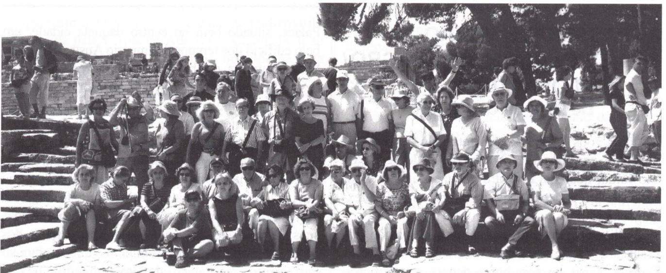
Palácio de Knossos

Destacam-se, nesta cidade, o "porto velho" (edificado pelos venezianos), as torres e muralhas venezianas, rodeando a "cidade velha" ou centro, a fortaleza à entrada do "porto velho", a Igreja de S. Tito, patrono da ilha, e a basílica de S. Marcos, também padroeiro dos venezianos.