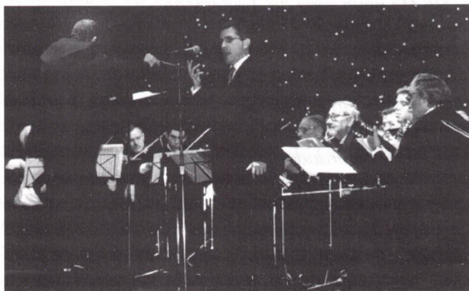
A orquestra e o solista