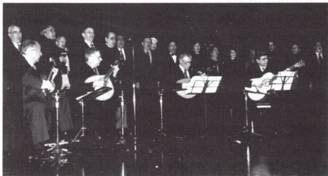
A apoteose final