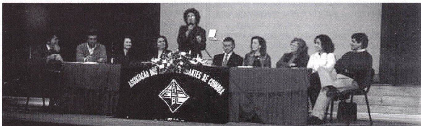
Os Coordenadores e seus Convidados