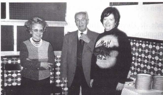
Aniversariantes de Dezembro