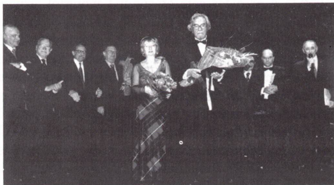
O homenageado e sua Mulher

Espero que, em sintonia comigo Sintam, naquilo que não digo, O que gostaria de vos dizer... Por isso levanto a voz E, num grande e apertado abraço Que para isso tenho tempo e espaço Envolve todos, e a cada um de vós Emocionado Digo: - Amigo Muito obrigado!"