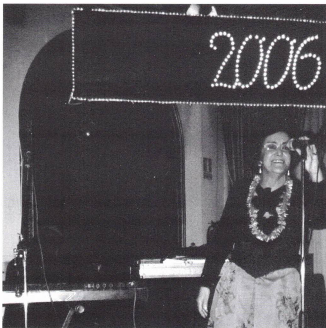
Coimbra em terras de Espanha, no início de 2006

O dia 1 de Janeiro foi assinalado com um Show de Flamengo no "Pátio Andaluz", de grande qualidade.