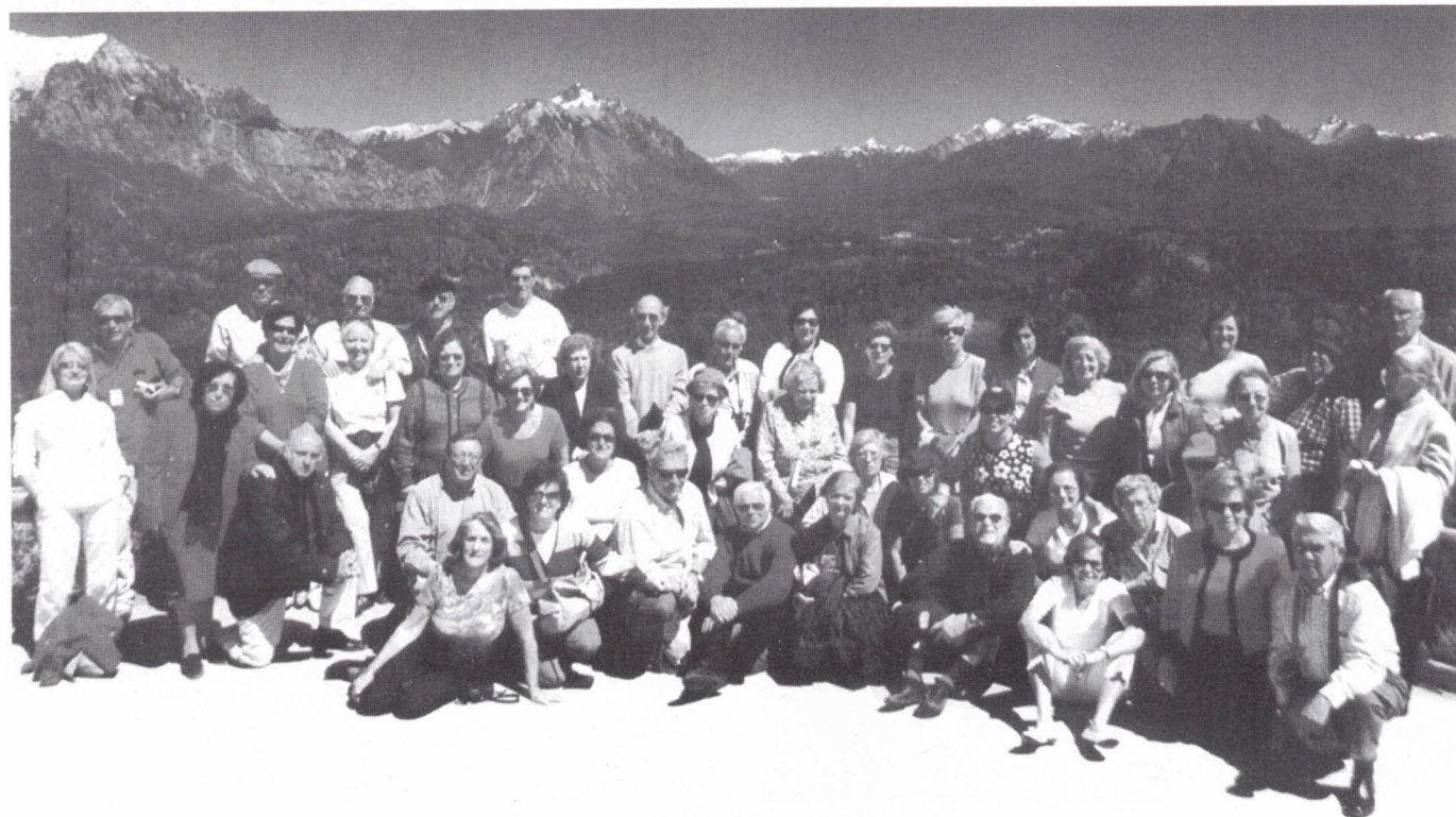
No Cerro Campanário depois de uma subida de “ Aerosilla ” e em frente a uma paisagem fabulosa

O dia seguinte foi uma sucessão de locais agradáveis através da cordilheira andina; Parque Nacional André Jimenez, travessia em barco do Lago Esmeralda, Puerto Varas, almoço em Peulla, na fronteira entre Chile e Argentina em plena cordilheira dos Andes,