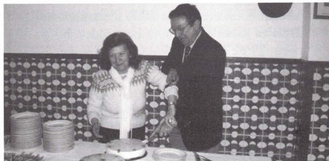
Aniversariantes de Maio