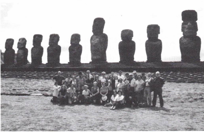
O conjunto de Moais Ahu Tongariki

com 15 Moais de diferentes alturas e compleições, alinhados e virados para terra.