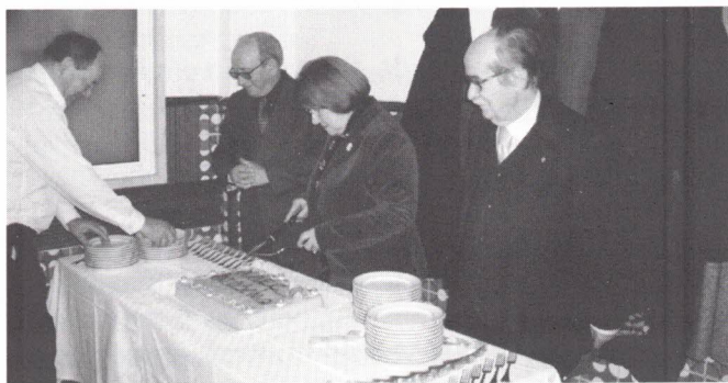
Aniversariantes de Fevereiro

E quem fica a ganhar mais são os aniversariantes desse mês que estão presentes: