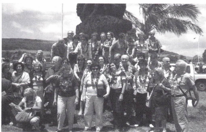
Chegada à Ilha da Páscoa, já com os colares de flores

À chegada fomos recebidos com colares de flores oferecidos pelos nativos e encaminhados para o Hotel Hanga Roa junto ao mar, com a maior parte dos quartos sendo agradáveis bungalows virados para a praia.