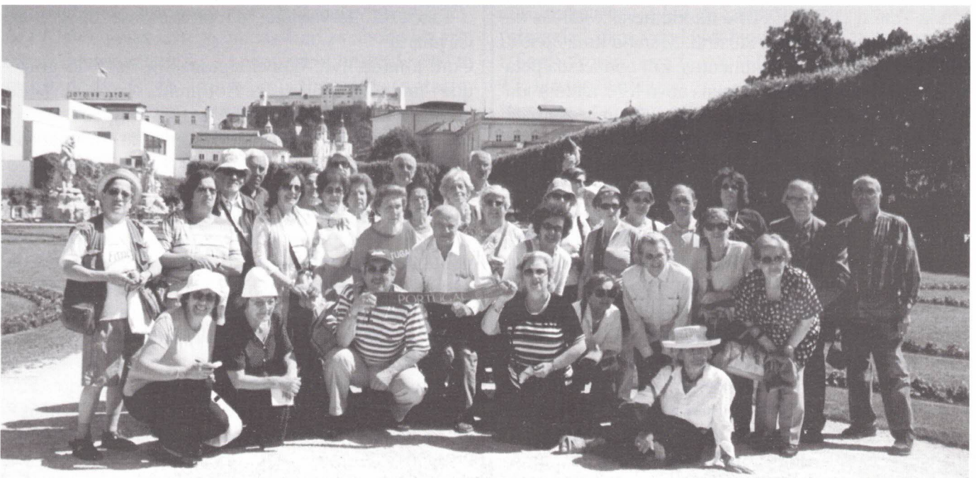
Nos Jardins do Palácio de Mirabel