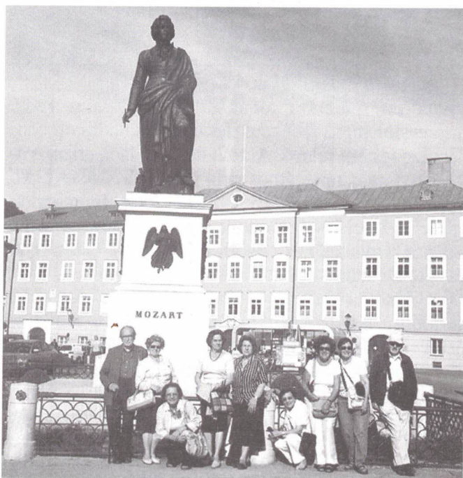
Homenagem a Mozart

15/06 - Começamos o dia em Salzkammergut , região dos lagos. São vários lagos para apreciar e fotografar. Parámos em St. Wolfgang onde a igreja tem um tríptico que conta a vida de Nossa Senhora. Tem o