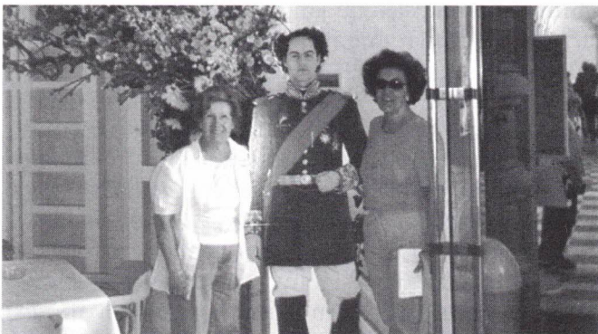
O dilema do austríaco: loura ou morena?