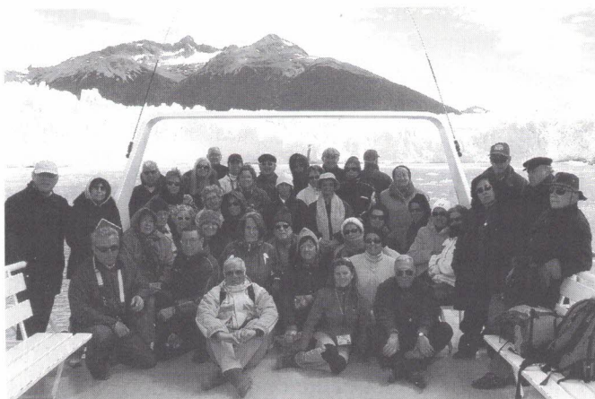
Com o glaciário Perito Moreno ao fundo, mais um momento inesquecível desta viagem

hospedados no Hotel Kempinsky e dali partimos para visitar, o mundialmente famoso, glaciário Perito Moreno.