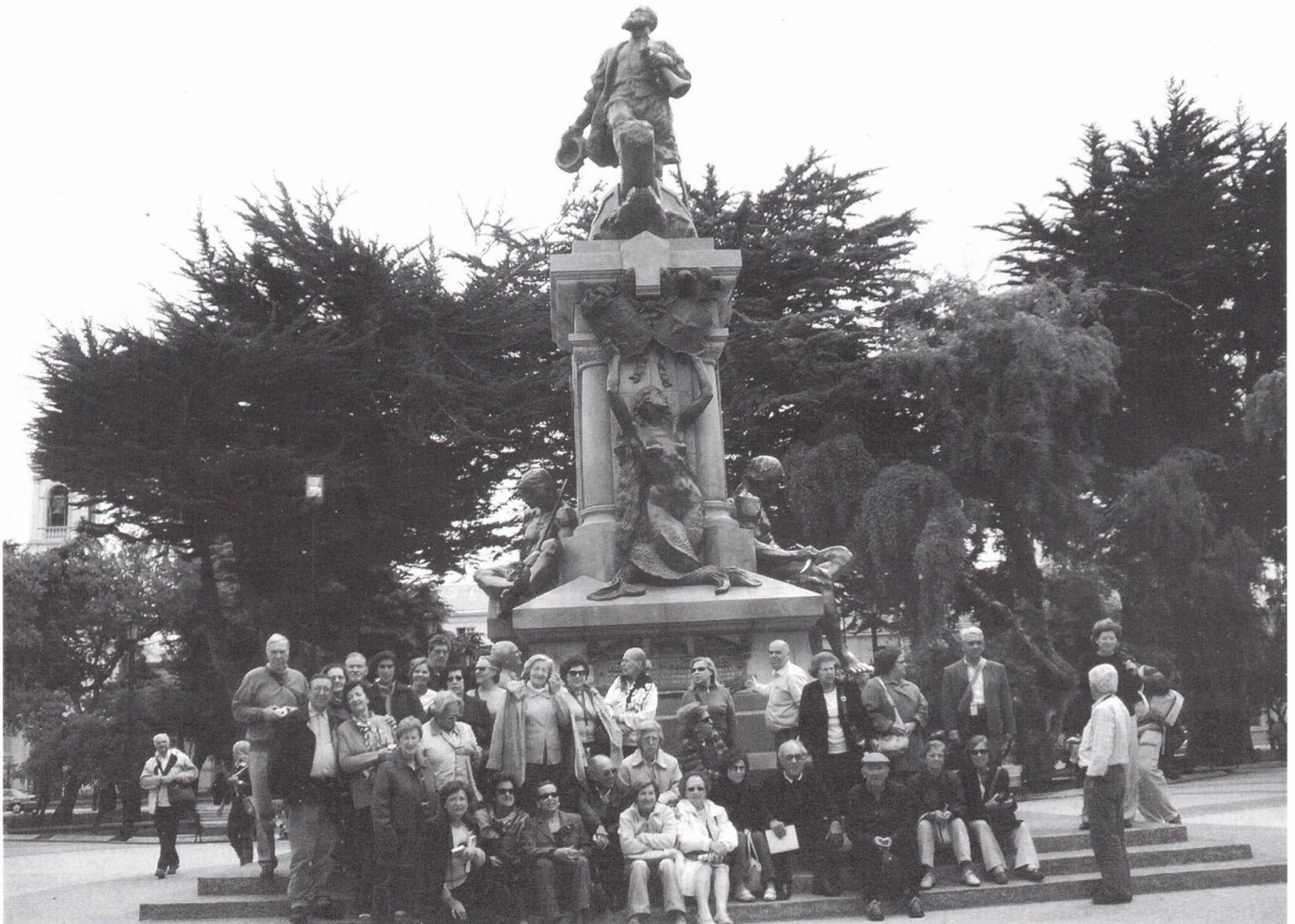
O nosso grupo aos pés da estátua de Fernão de Magalhães

Tudo ali é de pequenas dimensões; o edifício dos Correios, os bombeiros, a farmácia, os cafés (alguns com Internet), as lojas de artesanato. Contactámos com tipos de gente curiosos; um rapanui (os habitantes da ilha são designados rapa nuis ) que já ouviu falar de Portugal e conhece o Luís Figo, um espanhol de Zamora que veio cá de férias e cá ficou, já lá vão 20 anos (hoje é agente de turismo local), um guia nativo altamente sensível e que se comovia a descrever a sua terra e as suas origens, etc.