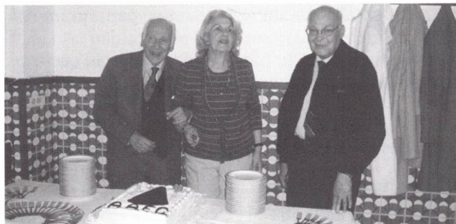
Aniversariantes de Março