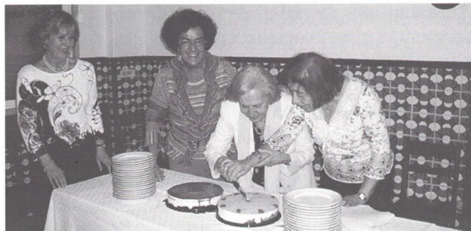
Aniversariantes de Junho