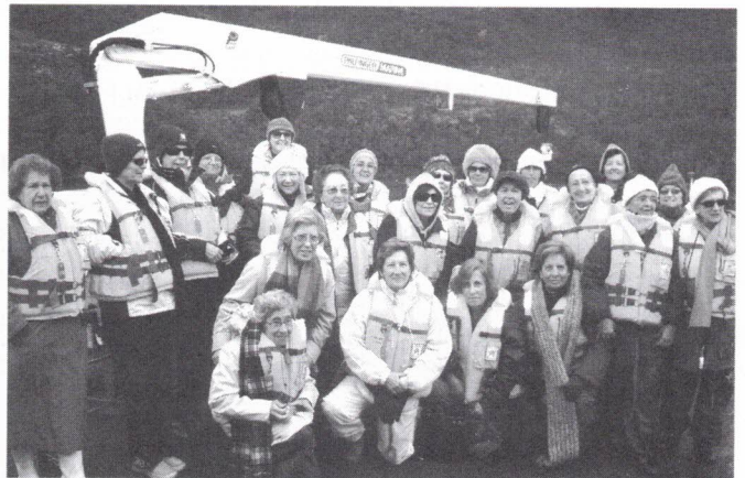
Preparando o embarque num bote que nos transportou sobre as águas geladas do Atlântico até ao Cabo Horn

Dali rumámos a Port William , a aldeia mais a Sul da Terra, habitada 50% pela armada chilena e suas famílias e depois, a Ushuaia , a cidade mais a Sul, território argentino.