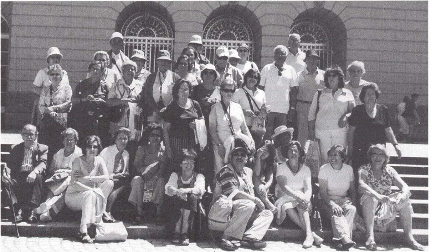
Palácio de Herrenchiemsee

pavimento em madeira com embutidos. O altar é de Pacher e data de 1481.