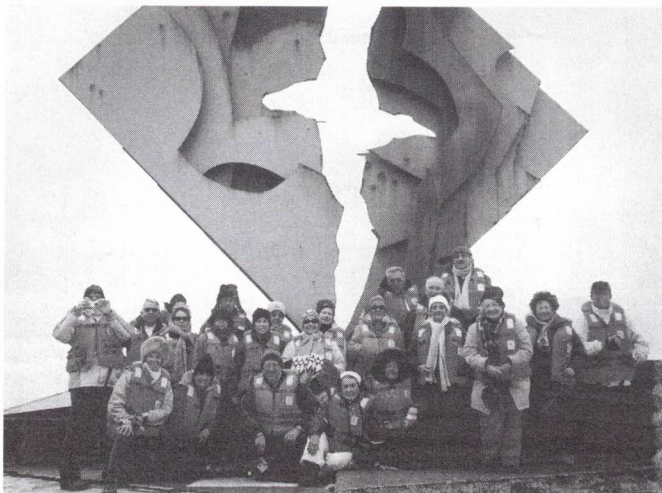
Momento único: junto ao monumento do Cabo Horn, com o albatroz recortado no horizonte

Patagónia Argentina e Chilena: Em Calafate ficámos