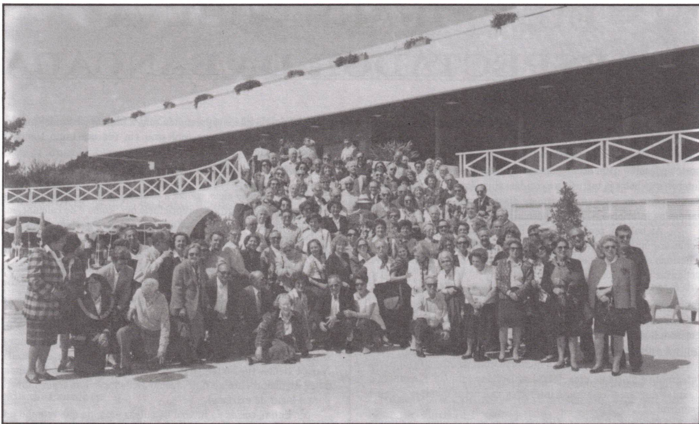
Grupo no Hotel Alvor

tradicionais e a esperança de que ali estava a nascer o núcleo do Algarve da Associação dos Antigos Estudantes de Coimbra.