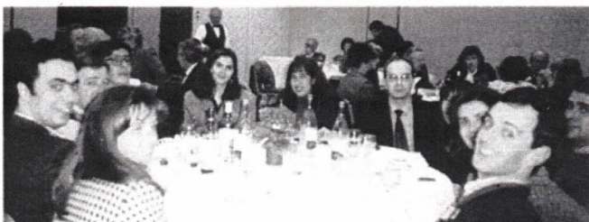
Jantar na Penta, em 1 de Março, com 28 jovens (de idade...)

A recente participação da Estudantina Universitária de Coimbra nas comemorações do 4º Aniversário da nossa Associação veio provar, mais uma vez, o quão próximos nos sentimos uns dos outros, independentemente das idades e das valências de formação de cada um. Se não, veja-se esta foto: