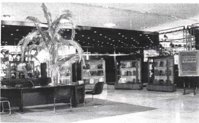
Exposição das Pastas Antigas de Luxo, no hall do Casino

Tivemos a ventura de apreciar cerca de 70, qual delas a mais bonita e valiosa, devidamente identificadas num catálogo orientador. Eis uma pequena parte: