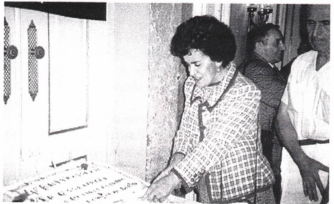
A nossa Presidente parte o Bolo de Aniversário, sob o olhar complacente do “Chefe” do buffet...

Estas fotografias ilustram bem o clima de euforia: