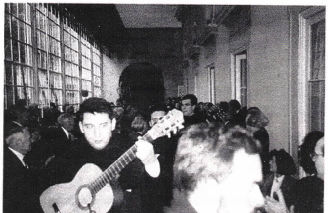
A entrada/surpresa da Estudantina

Que deste dia e destas imagens se retire o firme propósito de celebrarmos em uníssonos muitos e bem sucedidos aniversários da nossa Associação!!!