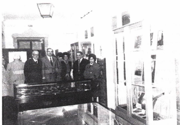
Exposição Evocativa do Menano, no Museu Académico de Coimbra.

Durante este acto, foi ainda posto à venda o prato cerâmico comemorativo da efeméride.