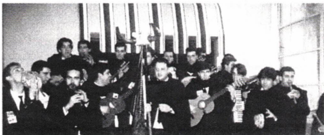
A Estudantina, cantando os "Parabéns à Associação"

A recente participação da Estudantina Universitária de Coimbra nas comemorações do 4º Aniversário da nossa Associação veio provar, mais uma vez, o quão próximos nos sentimos uns dos outros, independentemente das idades e das valências de formação de cada um. Se não, veja-se esta foto: