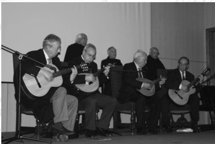
Grupo Porta Férra