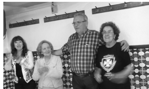
O bem disposto grupo aniversariante

Não obstante, os convívios conseguidos mantiveram bem viva a solidariedade e a alegria na saudação aos aniversariantes (ausentes e presentes) desses meses: