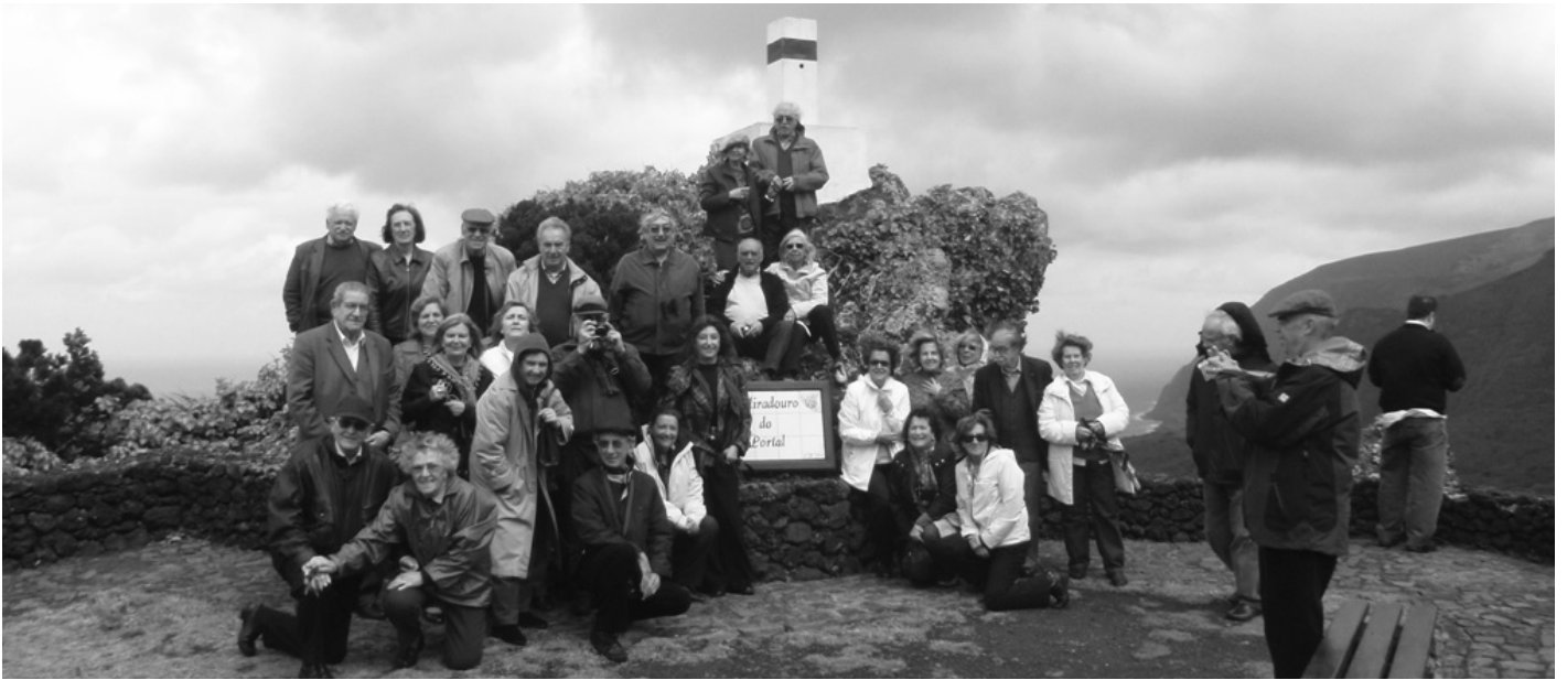
Os participantes na ilha das Flores

Dia 9 – Quarta-feira – Comparência no aeroporto às 4 da manhã. Tínhamos um bom grupo com 42 pessoas todas prontas para avançar para uma bela aventura. 06h30 – embarque num Airbus 310 da Sata com destino à Ilha das Flores (com escala em Ponta Delgada, Ilha de S. Miguel).