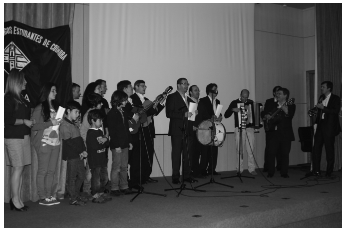
Grupo Madre Christu