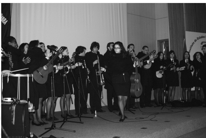
A Magna Tuna ApocallISCSPiana