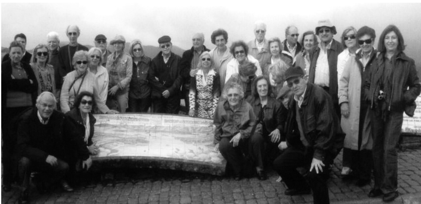
Foto de família na Lagoa das Sete Cidades

recida pela Esposa do Presidente do Governo à nossa presidente. Cerca das 13h00 saída com destino à Ilha de S. Jorge; já na sala de embarque, surgiu outro mas... voo cancelado por motivo de temporal em S. Jorge. Levantar as malas e repetir tudo outra vez! Alojamento no Hotel VIP Executive a expensas da Sata. Quando saímos do aeroporto já chovia novamente. Céu muito pesado, tecto muito baixo devido ao intenso nevoeiro. Dia 15 – Sol esplendoroso! Saída do Hotel VIP Executive, rumo à Ilha de S. Jorge ou Ilha do Dragão, muito montanhosa, com 58 km de comprimento, que nos recebeu com vento e chuva, mas avançámos de autocarro passando por Urzelina e Mandas, onde parámos para apreciar a beleza e riqueza da Igreja de S.ta Bárbara com um conjunto de Arte Sacra antiquíssima. Altar em talha dourada e sob o Altar o corpo do Senhor Santo Cristo morto. Seguimos até Calheta onde almoçámos no Restaurante "Os Amigos". Comemos inhame como acompanhamento (é uma raiz muito abundante na Ilha e muito utilizada na alimentação e que tem grande valor nutritivo). Os locais dedicam-se à criação de gado e produção de queijo. Tem mais ou menos 9000 habitantes. Porto da Calheta serve de piscina natural.