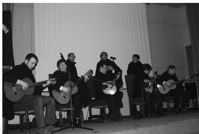
Grupo Serenata ao Luar