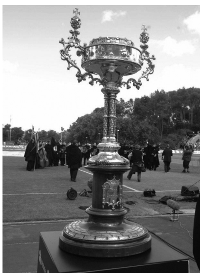
Académica faz história de novo