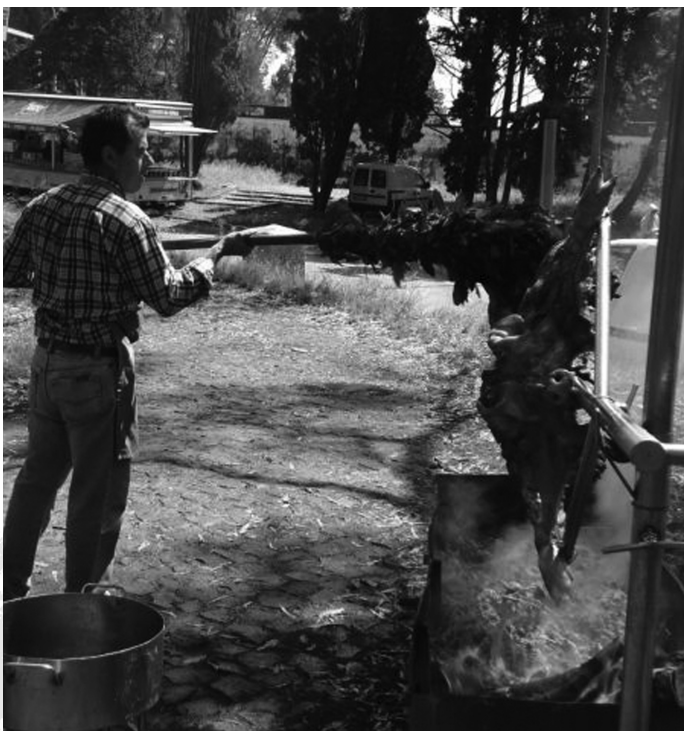
O porco no espeto para o almoço retemperador

Agradeço à malta que acarinhou a nossa participação na festa, incluindo o defunto suíno. Abraços e beijinhos. Até à próxima, que até os comemos!