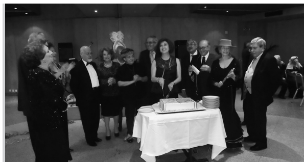
Os divertidos foliões de Carnaval

No mesmo Altis Park Hotel e seu aprovado buffet, é o pretexto mais abrangente para pôr à prova o sentido de humor na aceitação como verdadeiro do "bolo fingido" de aniversário (que antecede o genuíno e saboroso, claro), a jovialidade que os 82 participantes continuam a manifestar ao som de uma nova orquestra – Grupo Vintage –, constituída por jovens que aliam os ritmos mais modernos com as melodias de outros tempos..