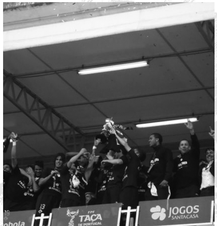
Momento da entrega da taça à AAC