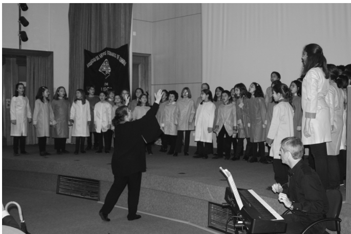
Coro Infantil - Univ. Lisboa