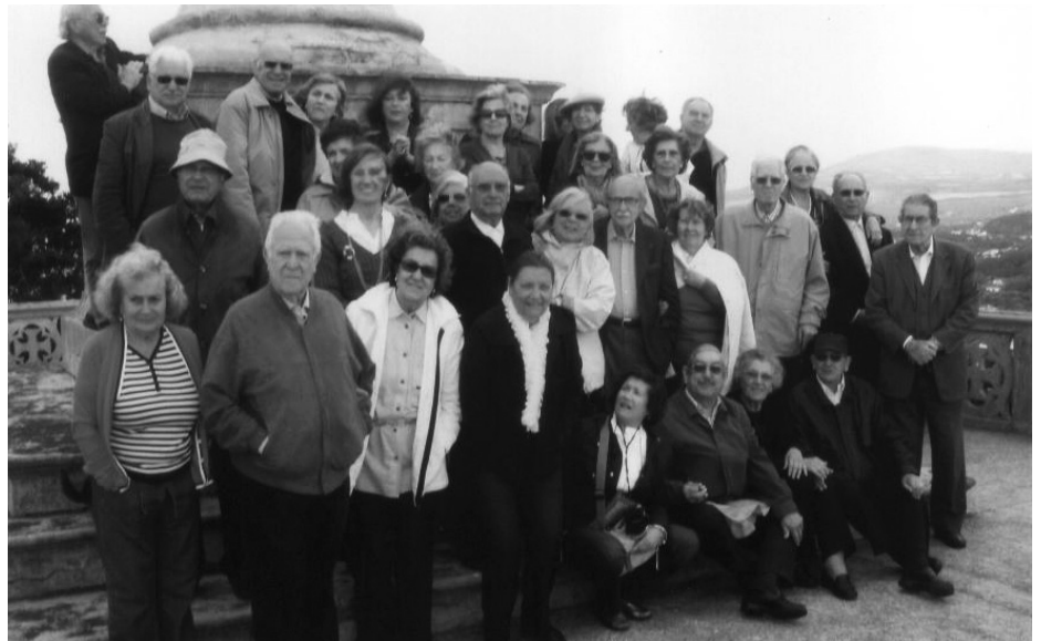
Os participantes no Monte Brasil

Dia 17 - Começámos por um passeio pela Ilha Graciosa, e visita às 3 ermidas: da Ajuda, de S. João e S. Salvador. Do cimo do monte das 3 ermidas via-se uma Praça de Touros, no fundo de uma cratera! Visita maravilhosa desta colina! A Graciosa é mais plana. Saímos do Monte das 3 Ermidas em direcção a Vila da Praia ou Lagoa. Vêem-se muitas manadas de vacas. Parámos em S. Mateus para tomar café, seguimos para Caldeira e Furna do Enxofre (lago subterrâneo), de difícil acesso, a desafiar os mais afoitos (que ainda foram muitos – viva a juventude!). Gruta da Moira Encantada onde