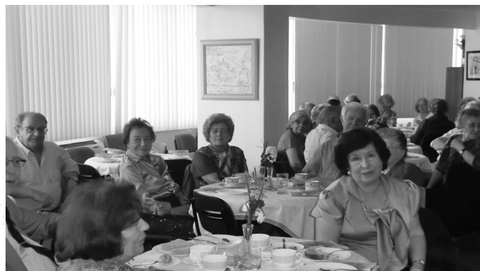
Participantes no Chá da Primavera

Isto sem prejuízo da procura de soluções que clamem a sua intervenção, material ou imaterial.