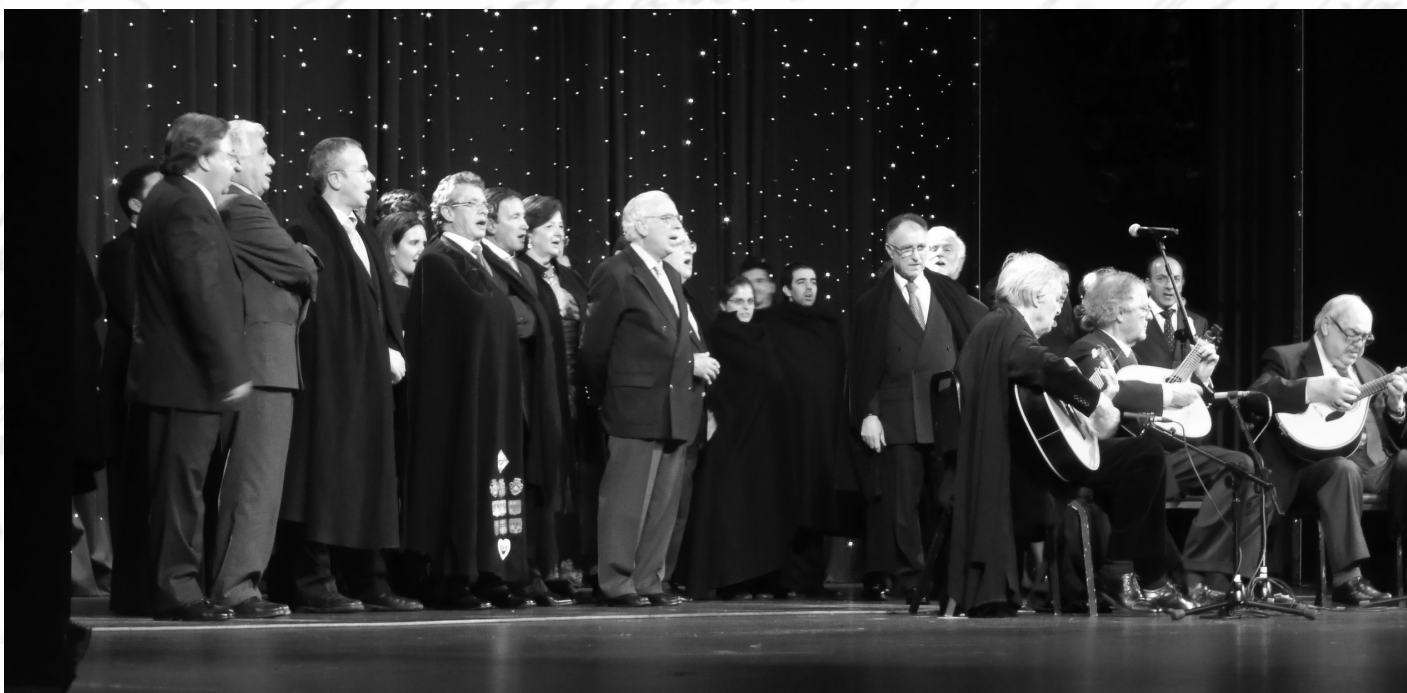
"Todos ao palco na Balada da Despedida"

O effe-erre-á da despedida juntou todos os participantes no palco, numa promessa de novo encontro em 2013!