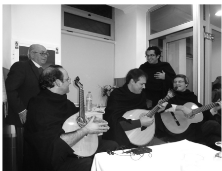
O Grupo Serenata ao Luar na Valenciana

Continuam sendo os espaços de mais íntimo convívio e participação de todos os presentes, desta vez em Julho, Setembro e Dezembro, com os usuais "Parabéns a Vocês" perante bolos de aniversário e atentas câmaras fotográficas: