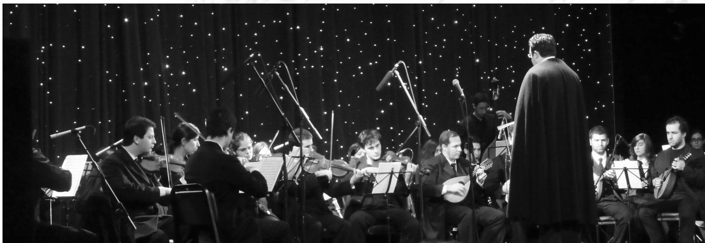
"Tuna Académica da Universidade de Coimbra"