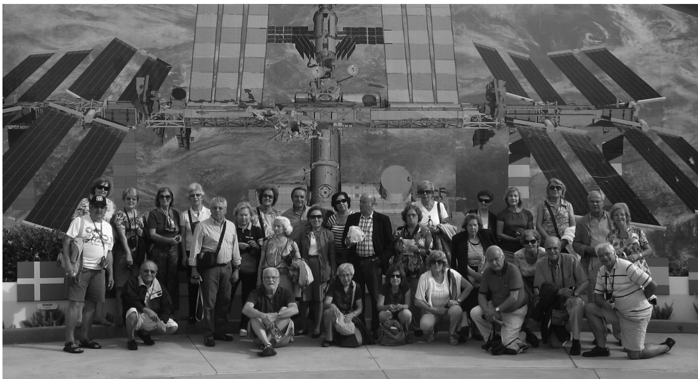
O grupo na visita às instalações espaciais

efeitos especiais, como simulação de tsunami, incêndios, chuvas e deserto da Califórnia.