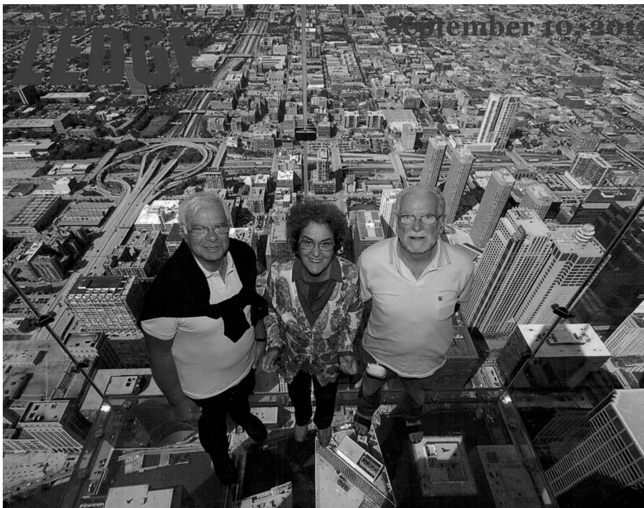
" Os 3 órgãos sociais da associação em suspensão..."

pedestal alcança os 97 m. Fomos presenteados com uma chuva bem intensa, que nem o guarda-chuva chegou... Valeram as capas de plástico, que se esgotaram... Depois, seguiu-se a visita a Ellis Island , uma ilha particular, com o nome da sua proprietária. Aqui permaneciam, de quarentena, os nativos e imigrantes dos vários cantos do mundo (mais de 12 milhões). De tarde subimos ao 86º andar do Empire State Building , edifício de 102 andares e 1200 funcionários.