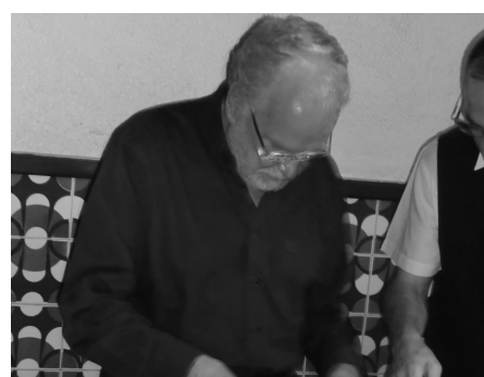
Aniversariante de Julho