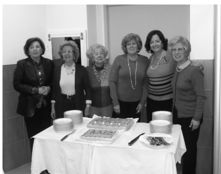
Aniversariantes de Dezembro