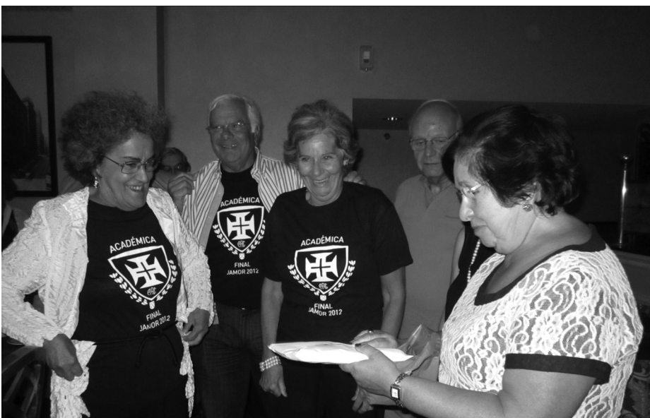
Na comemoração do aniversário... com t'shirt da vitória

Orlando , no Estado da Florida era a capital das laranjas, mas a Disney fê-la próspera e populosa (2 milhões de habitantes). Após o almoço veio a visita de Disney's Hollywood Studios , parte do Walt Disney World . Cada um de nós escolheu as visitas a fazer. De salientar o passeio de comboio ao Estúdio Backlot , que nos permitiu ver