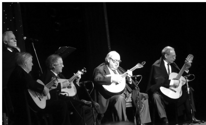
"Grupo Jurídico de Canto e Guitarra de Coimbra"