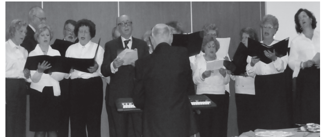
Grupo Coral Ad-Hoc – Almoço de Natal