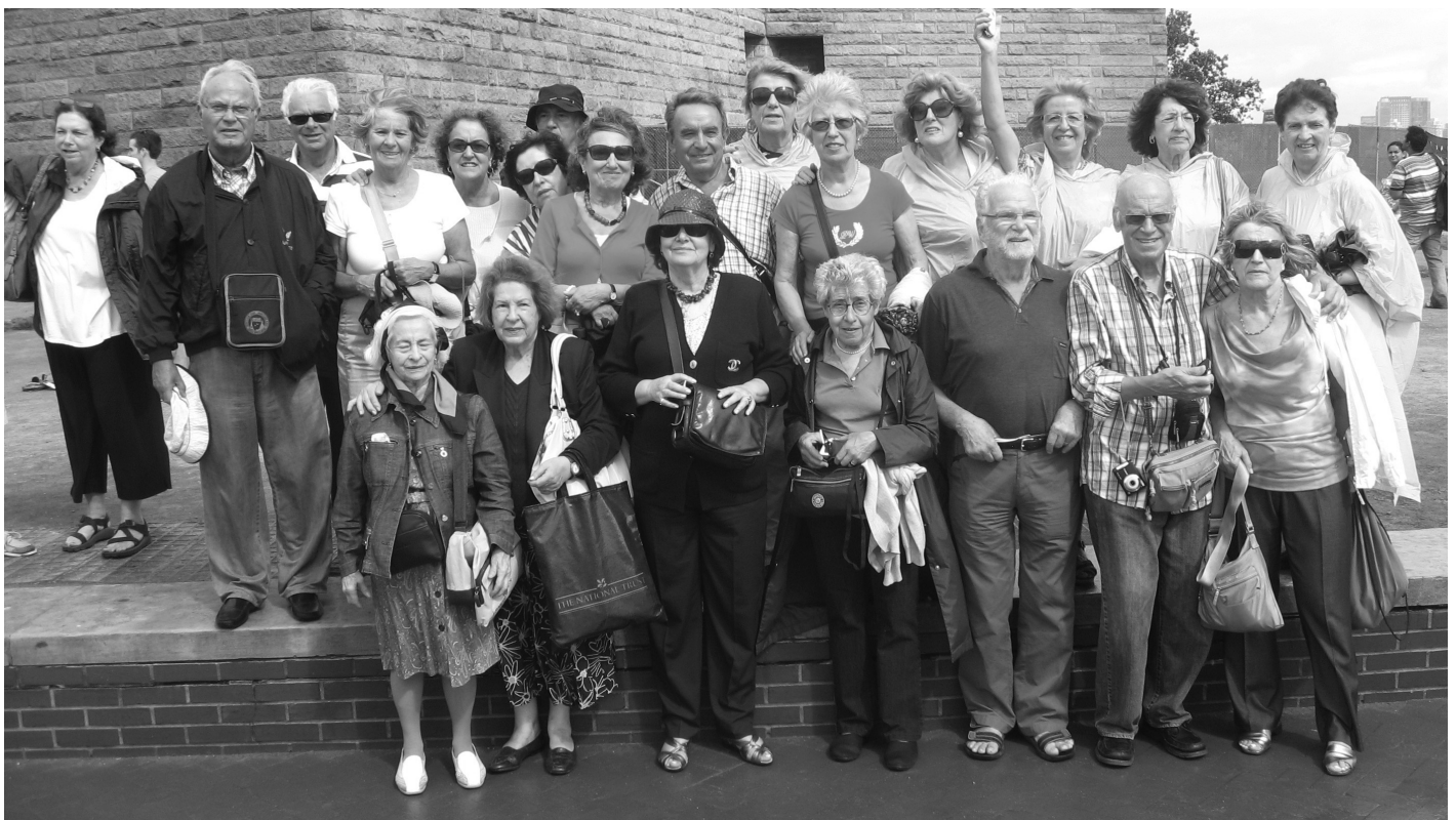
Visita a Ellis Island e à Estátua da Liberdade

Às tantas da madrugada o despertador cantou... E, 30 "ensonados" foram chegando ao aeroporto, cumprindo a hora programada – 4h da manhã!... Às 6h voámos para Paris, rumo a Nova Iorque, onde chegámos após 8 horas de voo e uma longa espera em Charles De Gaulle .