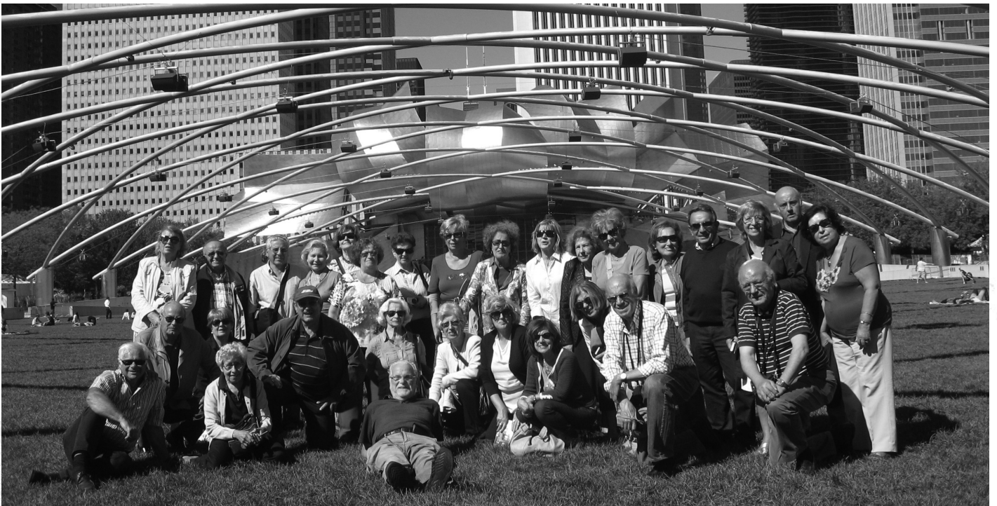
O grupo participante na viagem aos EUA

Assim se concretizou mais uma das excelentes viagens realizadas pela nossa Associação, que nos proporciona bons momentos de convívio e oportunidade de conhecer o Mundo.