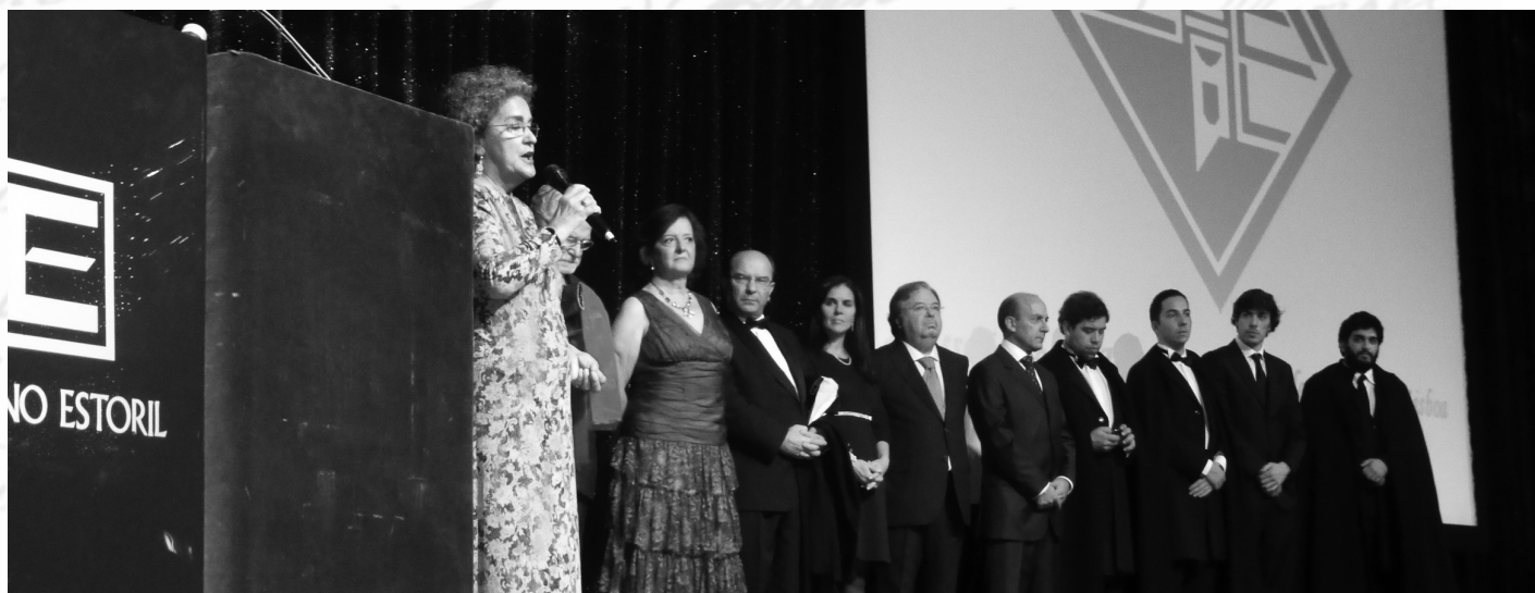
"As palavras de abertura do Show Nosso"