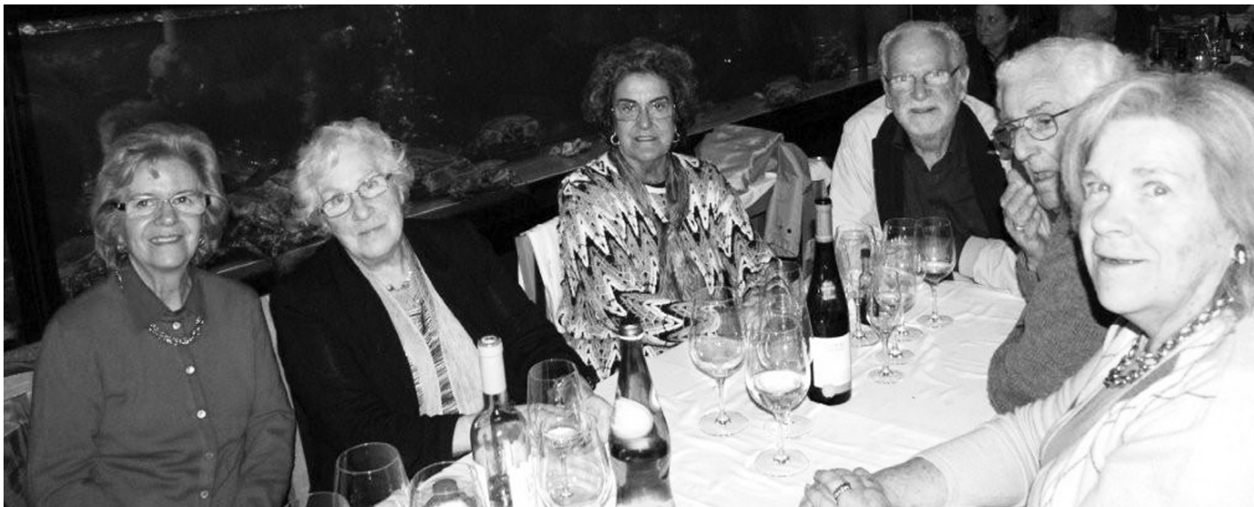
Passeio da Primavera 'Rota dos Escritores' 2013