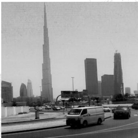
Dubai- Observatory Deck do Burj Khalifa – o edifício mais alto do mundo

Um novo dia surgiu com a partida para o Emirado de Abu Dhabi , distante cerca de 158 km do Dubai. Percorremos novamente a zona junto ao mar, vendo-se a zona da marina , com os seus arranha-céus, a zona da Palmeira com as praias, o palácio secundário do Xequ e o seu barco ancorado. Passámos depois por ilhas ligadas por pontes, com casas, onde em 2009 tudo era deserto... De re-