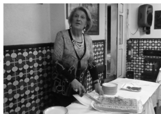
Aniversários de Março

Tiveram lugar apenas 2 (Fevereiro e Março), por se manterem, decerto, os propósitos de contenção nos gastos, a par de condições climatéricas pouco propícias.