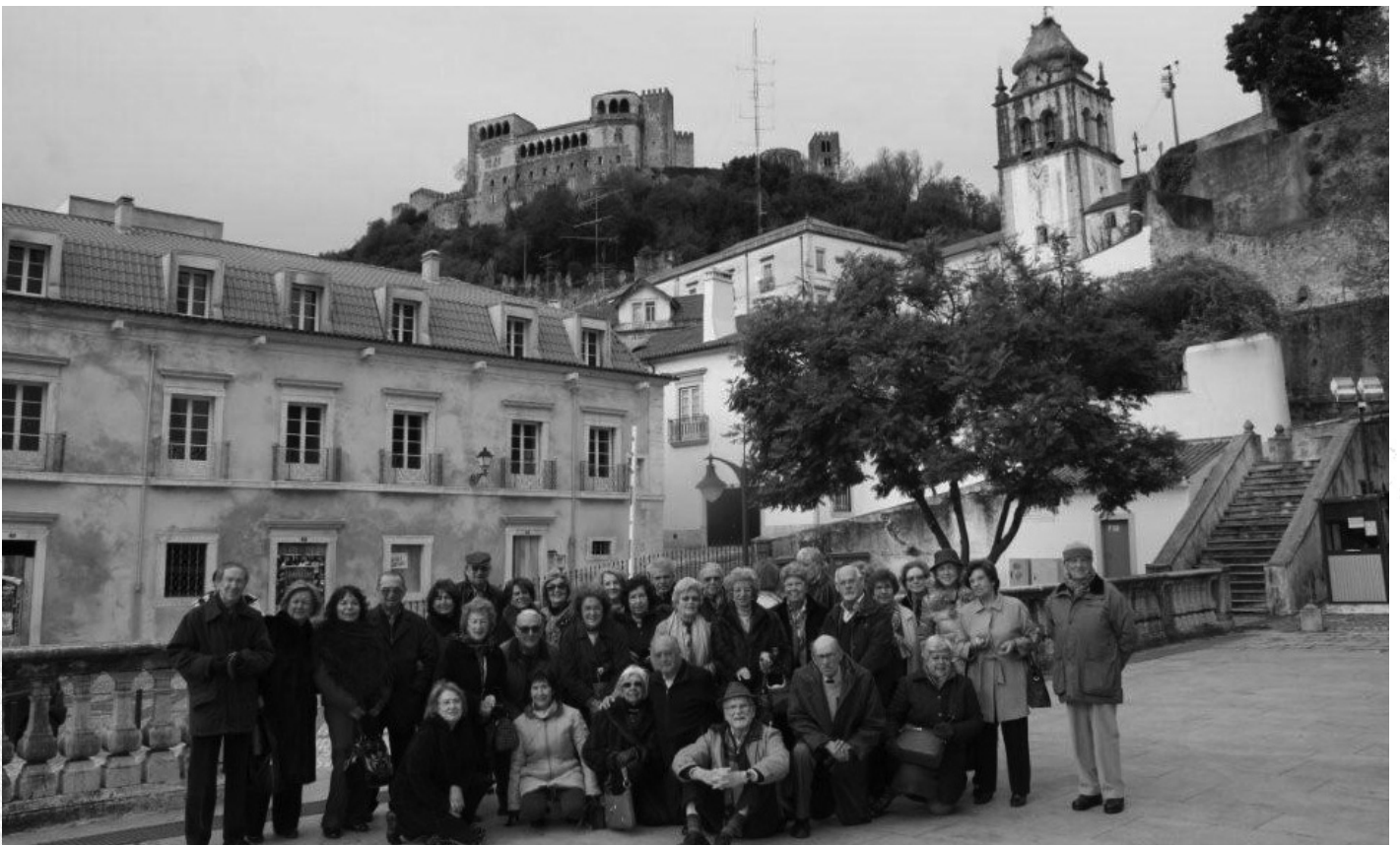
O grupo em Leiria

A conjuntura em que vivemos aconselhou uma passagem de ano mais "caseira", sem prejuízo da satisfação de estarmos juntos neste momento tão especial.