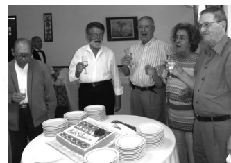
Aniversários de Junho