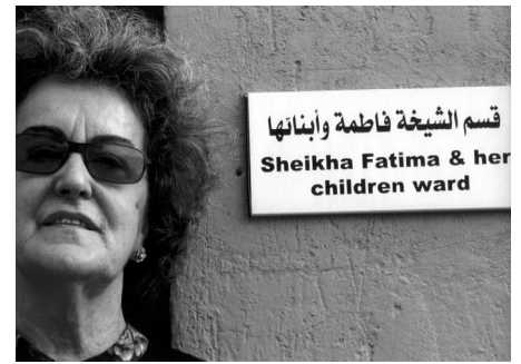
Sultanato de Omã - A Sheikha Fátima...

em direcção aos fortes da região da Batina , fazendo a viagem ao longo da costa até Barka , de modo a visitar o mercado do peixe no Souk Seeb , observando o peixe acabado de pescar, a lota e as bancas de venda do peixe.