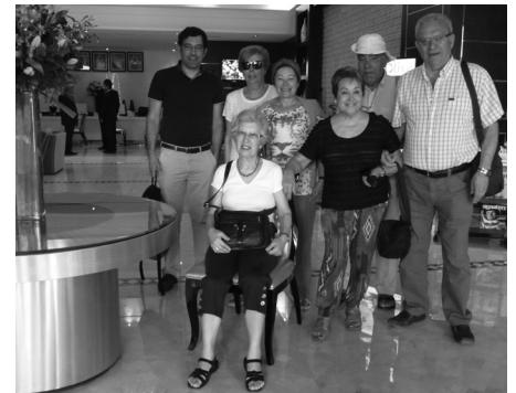
Bahrain – os 7 majestáticos resistentes

Regressados ao hotel jantámos e à 1h da manhã reunimo-nos no hall do hotel, para meia hora mais tarde irmos para o aeroporto. Feito o check-in embarcámos para o Dubai, esperando cerca de 5h pelo avião que nos traria a Lisboa.