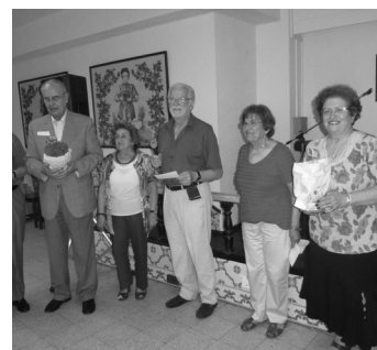
O Júri e os premiados