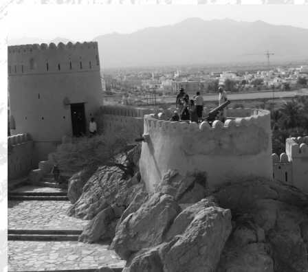
Omã- Forte Nakhal ou Al Husn Heem

Seguidamente visitámos Bait Al Quran , a Casa do Corão, que abriga manuscritos do Alcorão recebidos de todo o