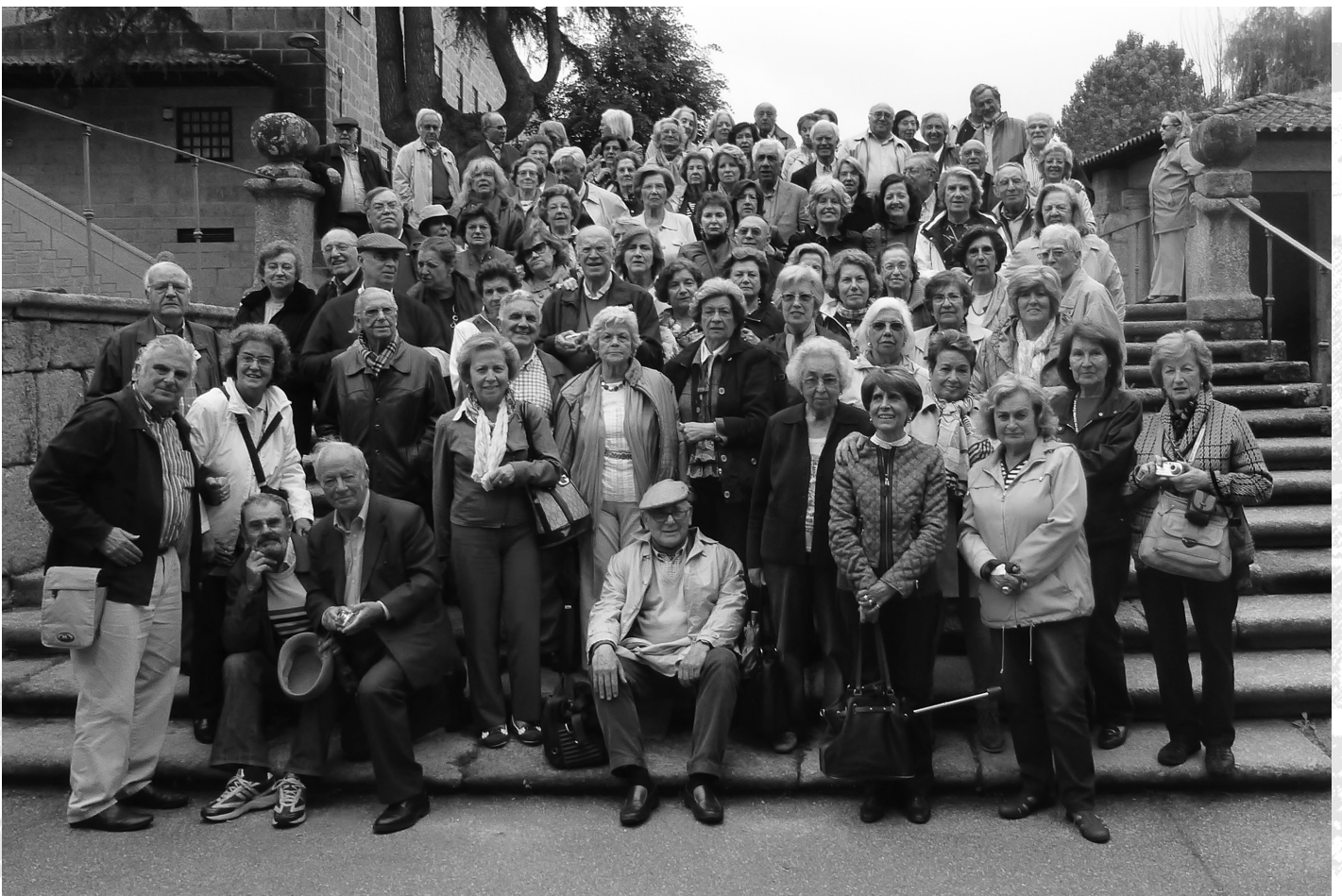
... a excelente companhia...

E o Melhor Hotel, sem dúvida, o Hotel Cidnay, em Santo Tirso: moderno e com uma bonita arquitectura, integrando trechos naturais, nos seus vários desníveis. A terminar, a avaliação da viagem: bom passeio, com temas bem escolhidos, boa organização, excelente companhia.