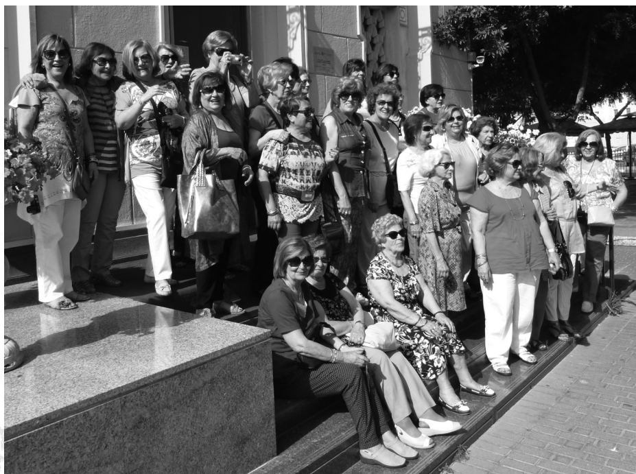
Mesquita de Fujeirah – grupo feminino

Continuando, pudemos observar a magnífica vista sobre a baía do Dubai, de onde se realça a torre mais alta e o hotel mais luxuoso do mundo, o Hotel Burj Arab. É a famosa zona de Jumeirah.