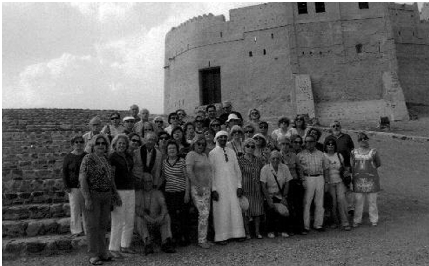
Al Ain _ Fujairah - grupo junto ao Forte Bitnah

700 km 2 , mas ainda há muito território conquistado ao mar.