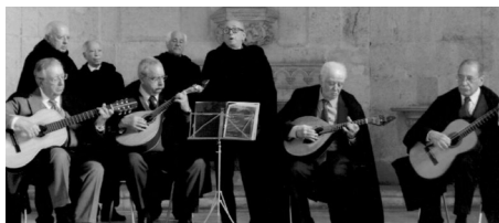
O Grupo "Porta Férrea"

Actuaram os Grupos "Porta Férrea" em 10 de Novembro, o "Serenata de Coimbra" em 17 desse mês e, em 1 de Dezembro, o "Serenata ao Luar", que teve a iniciativa de projectar imagens alusivas à Universidade, à Academia e suas tradições como pano de fundo das interpretações. Ei-los: