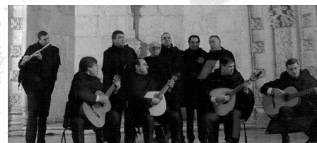
O Grupo "Serenata ao Luar"