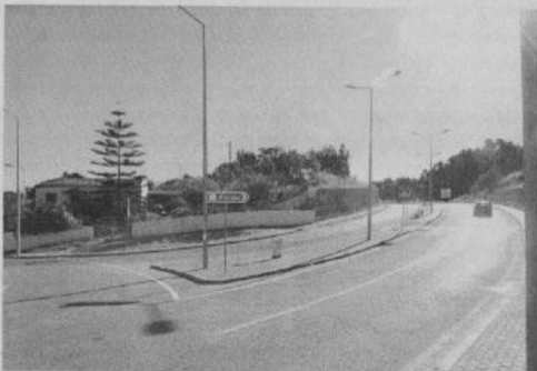
Pormenor da Av. Joaquim Teixeira Santos