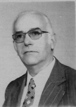
Freguesia de Antanhol 14 de Setembro de 2013