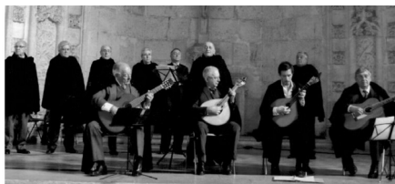
O Grupo "Serenata de Coimbra"