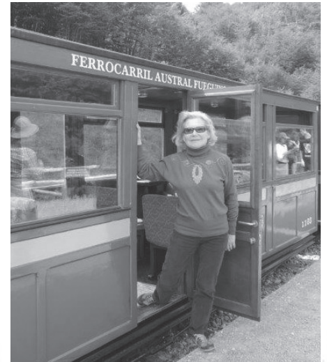
Trem do Fim-do-Mundo

Já no Chile, novamente de barco pelo lago de Frias, até Puerto Frias. De novo de autocarro até Peulla onde almoçámos, partindo para Petrohué outra vez de cruzeiro no lago de Todos os Santos. Em Puerto Varas ficamos no Hotel