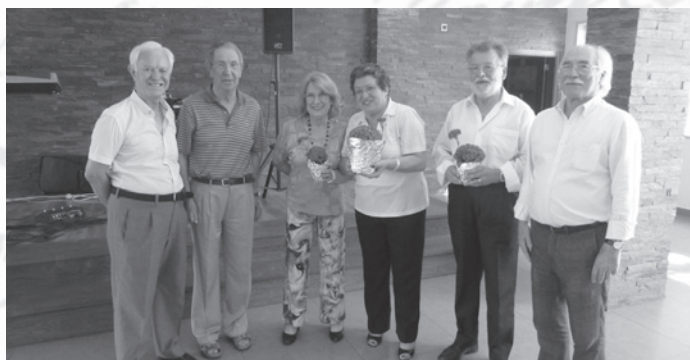
O Júri e os laureados";

A Valenciana disponibilizou um músico, que animou toda a gente com a sua actuação, mas que teve o senão de tocar demasiado alto, de tal modo que era necessário gritar para