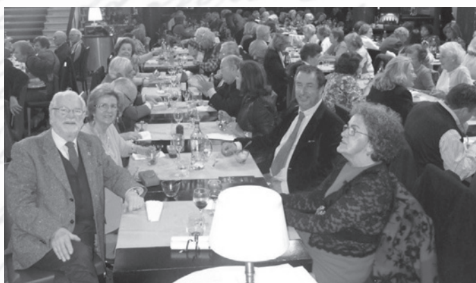
Os representantes da Reitoria da Universidade de Lisboa, da Assembleia-Geral e da Direcção da aniversariante