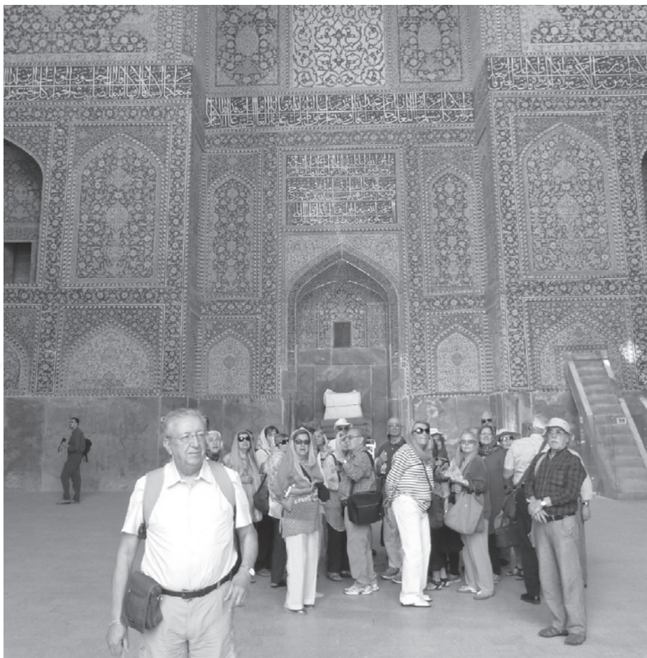
Na sala maravilhosa do Mausoléu

ferida para o túmulo de Ali em Meca. O Palácio compreende 7 andares, cada um com sua função. Do 3º andar pudemos desfrutar uma bela paisagem: cúpulas, minaretes, a Praça Imã e as montanhas. No 6º andar, a sala de música, com os nichos escavados no estuque proporcionavam um efeito decorativo no exterior e uma boa acústica. O último andar destinava-se aos músicos. Após o almoço, no restaurante Bastani, houve colegas que foram às tapeçarias, enquanto os restantes foram gozar a sesta, no hotel.