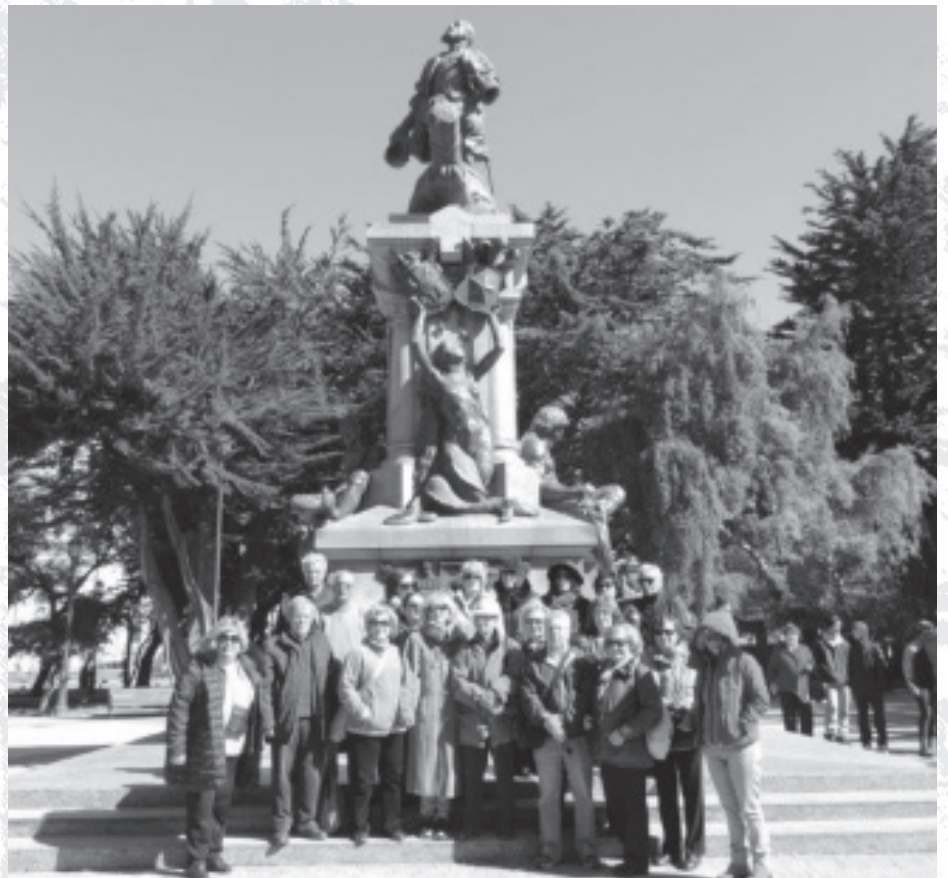
O grupo junto ao monumento a Fernão de Magalhães

O hotel de Las Américas foi o nosso ponto em Buenos Aires e começámos logo o programa com o jantar em Puerto Madero, um dos bairros típicos da cidade. Os três dias seguintes foram dedicados à capital da Argentina, visitando tudo aquilo a que tínhamos direito.