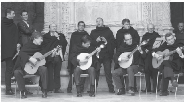
O Grupo "Serenata ao Luar"