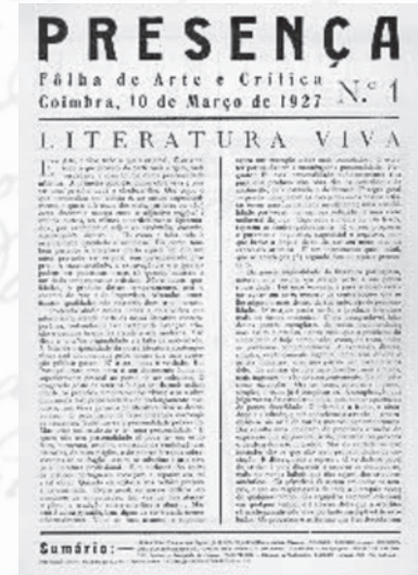
O nº 1 da Revista Presença , 1927

Seguimos a exposição do ilustre conferencista com óbvio proveito e ao mesmo tempo com prazer. Com proveito e prazer porque na sua dissertação, improvisada sobre abundantes notas criteriosamente seleccionadas e ordenadas num discurso fluente, coloquial, o erudito historiador e judicioso crítico seguia a par e passo com o reputado escritor, memorialista e poeta, ou antes, os dois seguiam à vez, cedendo-se a palavra conforme no discurso se tratava de factos documentalmente provados, análises