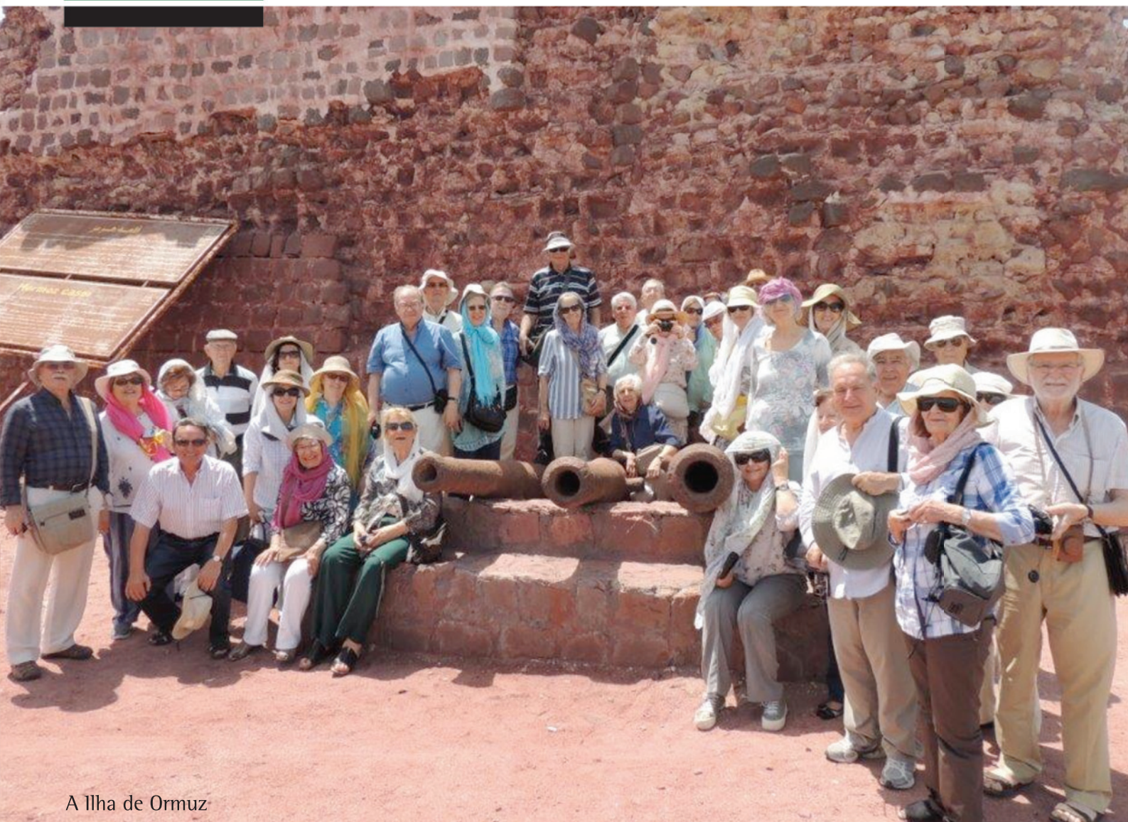
A Ilha de Ormuz

Associação dos Antigos Estudantes de Coimbra em Lisboa