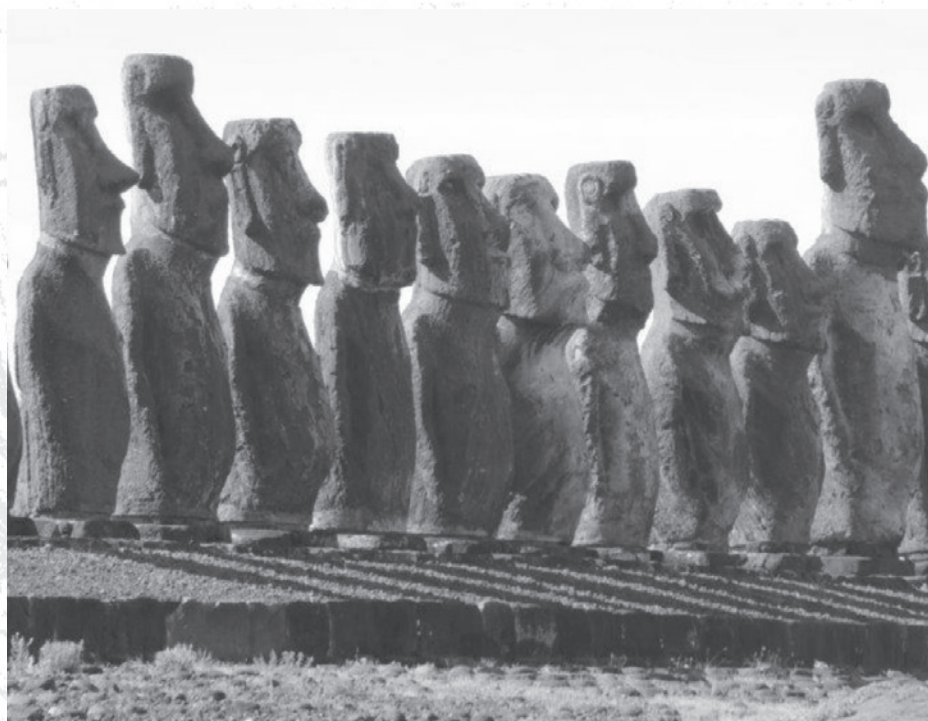
Grupo De Moais

Na parte da tarde e dia seguinte visitamos os locais de interesse, como os sempre impressionantes Moai de uma