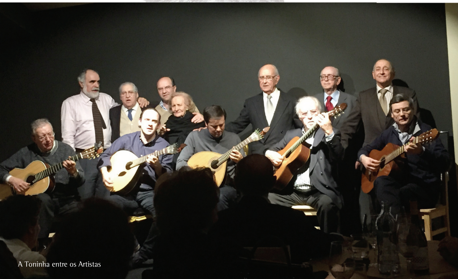
A Toninha entre os Artistas