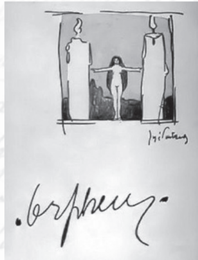
Capa do nº1 da Revista Orpheu , 1915, da autoria de José Pacheco

Foi, assim, com grande regozijo que aceitámos o título livremente escolhido pelo nosso convidado para a conferência do jantar comemorativo do Centenário do Modernismo em Portugal: O Orpheu e a Presença . A sua conferência sobre o Modernismo não seria, portanto, apenas sobre o movimento na sua primeira fase, esse de 1915, o do Orpheu , que, em seu tempo, se confinou por assim dizer em Lisboa, mas também o de 1927, o da presença , de Coimbra, que lhe deu projecção nacional, os dois constituindo, afinal, "o" Modernismo, embora preservando, naturalmente, a alteridade que distingue cada qual relativamente à sua estética e ideias. A conferência viria a abranger, de facto, o Modernismo em ambas as fases, ou seja, o Modernismo da geração modernista de 1915, de Lisboa (do Orpheu , etc.) e depois o do seu estudo, interpretação e expansão na cultura portuguesa pela geração coimbrã de 1927, ou seja, a geração dos já citados Régio, Gaspar