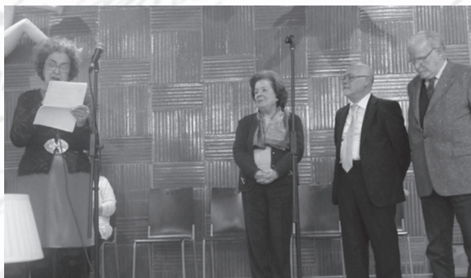
Os Homenageados (ao centro)

no caso de Coimbra – sem cujo contributo não teria sido possível a classificação pela UNESCO da nossa "Alma Mater" da Universidade portuguesa.