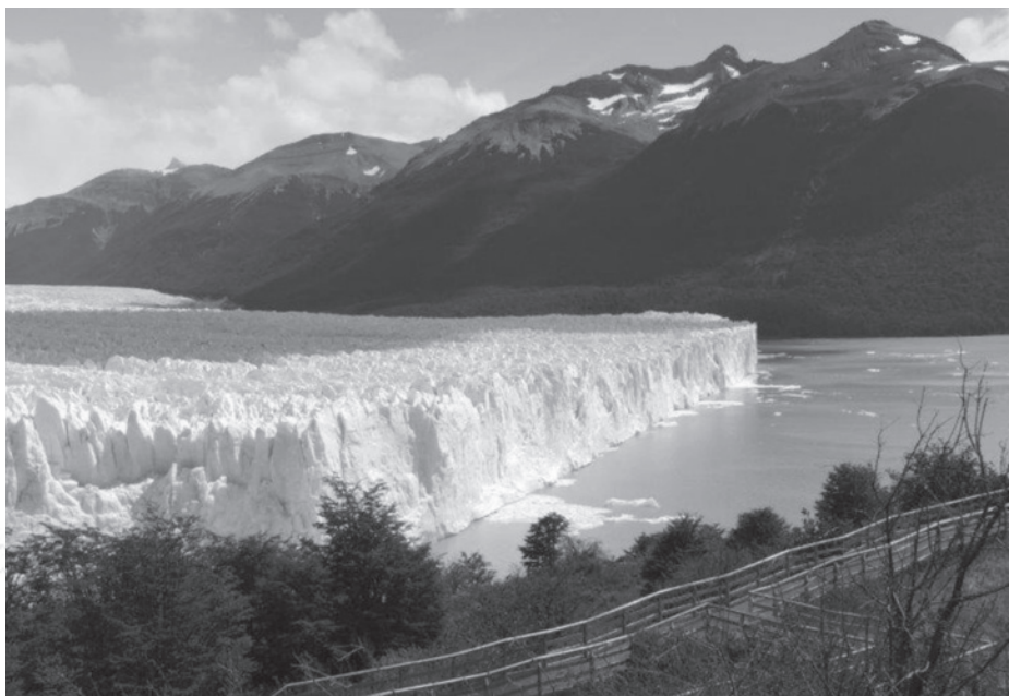
Glaciar Perito Moreno