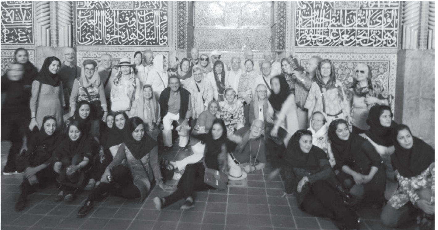
Convívio inesquecível com iranianas

Cerca do ano 651 dC, o Irão foi conquistado pelos árabes muçulmanos e em 1501, o Império Safávida adotou o Xiismo como religião oficial. Em 1978 começou a revolução iraniana e em 1979 o Xá Reza Pahlavi foi deposto, levando à transformação do país numa república islâmica, sob o comando do Ayatola Khomeyni.