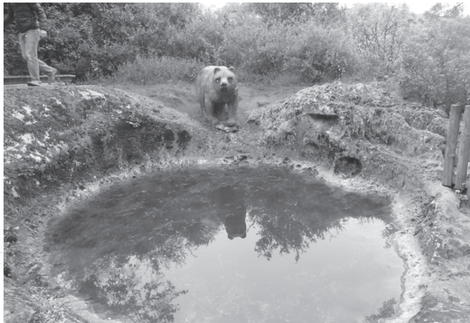
Pia do Urso

Deliciámo-nos com um esplêndido almoço no Restaurante “ O Rito ”, no Alqueidão (próximo de Ourém) e de seguida, visitámos o Museu Municipal de Ourém/Casa do Administrador, onde pudemos observar a fotografia de Artur de Oliveira Santos com a mulher e 6 dos seus 8 filhos (2 nasceram posteriormente, já em Lisboa) e também alguns objectos que dizem respeito à forma como se vivia na época. Continuámos para Aljustrel, para visitar as casas onde viveram os pastorinhos. Já não visitava este local há alguns anos e fiquei horrorizada com o que fizeram daquele local (que tinha sido duma grande simplicidade e onde tive oportunidade de conversar com João, o irmão da Irmã Lúcia). Agora é uma zona inteiramente dedicada ao consumismo, onde se vende de tudo e que é percorrido por centenas de