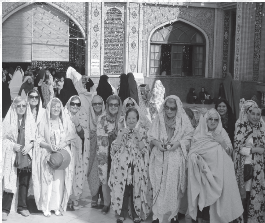
Entrada do Mausoléu de Shah Cheraq em Shiraz

O país foi o berço de uma das civilizações mais antigas do mundo (a Faradiba e o Xá comemoraram os 2 500 anos do país). Atingiu o apogeu durante o Império Aqueménida, fundado por Ciro em 550 a.C.