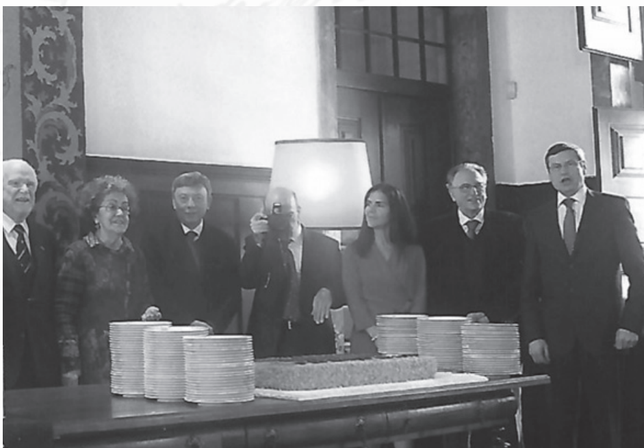
Cantando o aniversário com o ilustre Palestrante