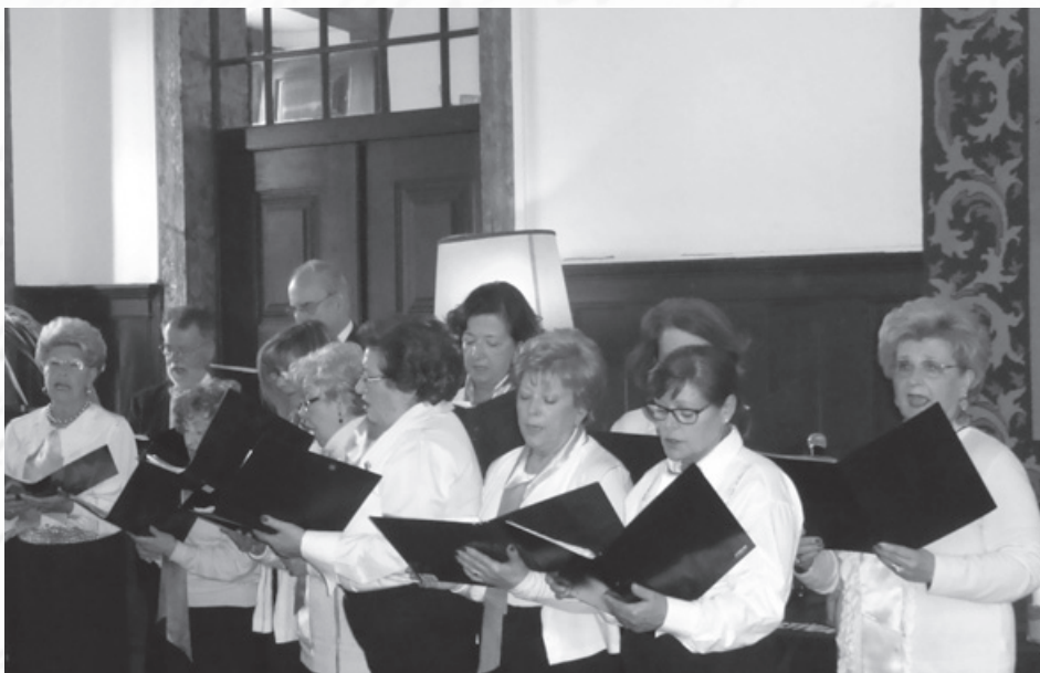
O Coral Ad-Hoc em magistral exibição.

A presidente da Direcção devolveu aos 124 convivas presentes (e aos muitos outros que incentivaram) o mérito de transmitirem força anímica aos seus "dirigentes" para encetarem novo mandato (o 8º para si própria e alguns ou-