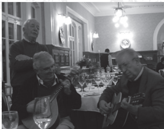
Os Cultores do Fado de Coimbra

As visitas a: Cantanhede — Igreja Matriz, Igreja da Misericórdia, estátua equestre do Marquês, Paços do Concelho; a Ançã , com o seu famoso Museu da Pedra, preferida pelos escultores desde o séc. XIV para os monumentos da terra — Casa dos Marqueses de Cascais, Pelourinho e Fonte de Ançã — e também adoptada por Coimbra na escultura dos portais, capitéis e imagens; a Avanca — Casa-Museu Egas Moniz, com o seu notável espólio; e a Ovar — Museu Júlio Dinis, uma Casa Ovarense, todas elas enriqueceram os dois últimos dias de 2015, em jeito de despedida e passagem para o próximo ano no majestático Curia Palace Hotel . Aqui pernoitámos duas noites, festejámos o réveillon e apreciámos o sempre delicioso brunch do Ano Novo, no dia 1 de Janeiro. Para além da excelência das visitas, da qualidade do alojamento e