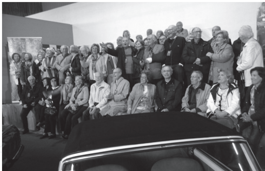
No Museu Municipal do Automóvel de Vila Nova de Famalicão

Foi tudo bem planeado, Pensado com dedicação. Lisboa 25 de Maio de 2016