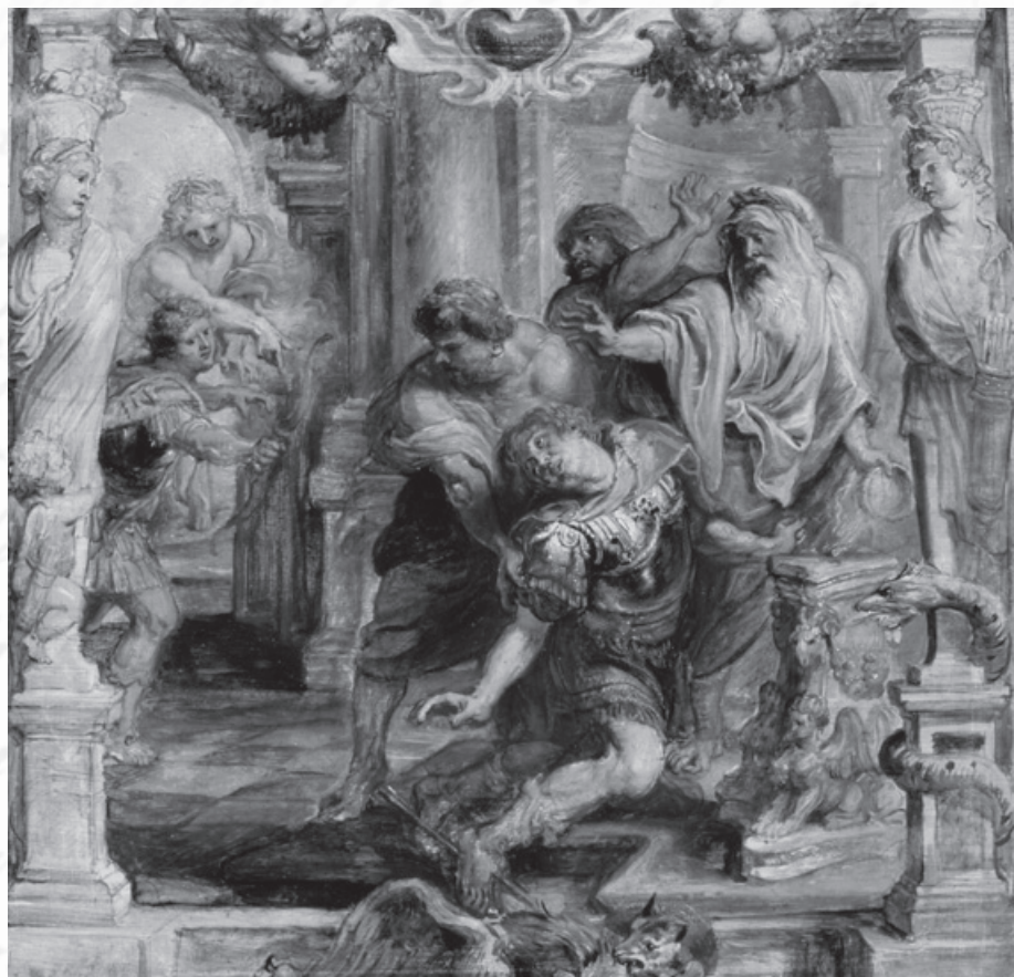
Fig. 3 - A morte de Aquiles. Óleo de Rubens (1630-1635). Rotterdam, Museum Boijmans Van Beuningen.

Da mitologia clássica provém também a expressão "o pomo da discórdia". Nas bodas de Tétis e Peleu, Éris (a personificação da Discórdia) ateu a chama