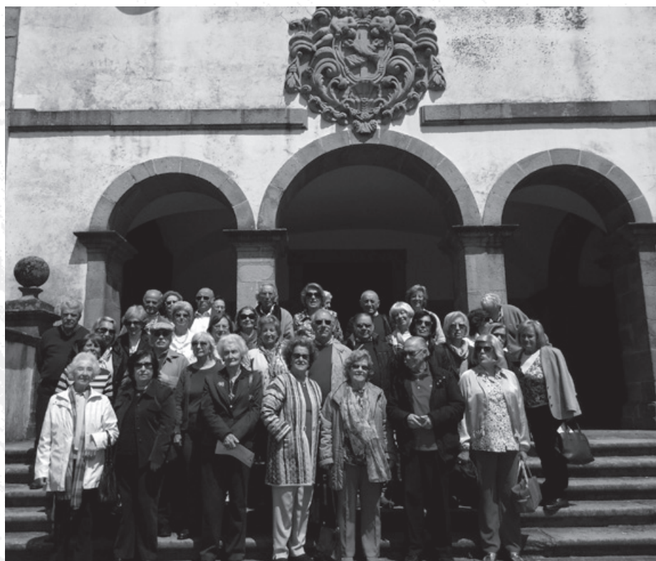
O grupo nas escadas da Capela de S. Frutuoso de Montélios

No dia seguinte viajámos até Famalicão E o Museu do Automóvel visitámos. Tinha cerca de 100 exemplares, Exposição que muito apreciámos. Desde o Ballila ao Jaguar, De que sou grande apreciadora, Até aos relógios de parede, Feitos pela "Boa Reguladora". Seguidamente fomos almoçar Ao Restaurante "O Tanoeiro":