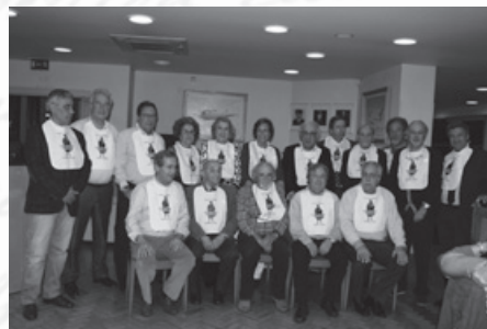
As Confreiras e os Confrades-Jantar Briososa

Os Confrades da Briososa dedicam também especial atenção à gastronomia, pretendendo uma interligação entre o convívio, a cultura académica e o prazer da Mesa. Todos os Confrades ostentam os seus canudos e o Babete de uso obrigatório, devendo obediência a um velho Chocalho que pontua as intervenções e cerimónias