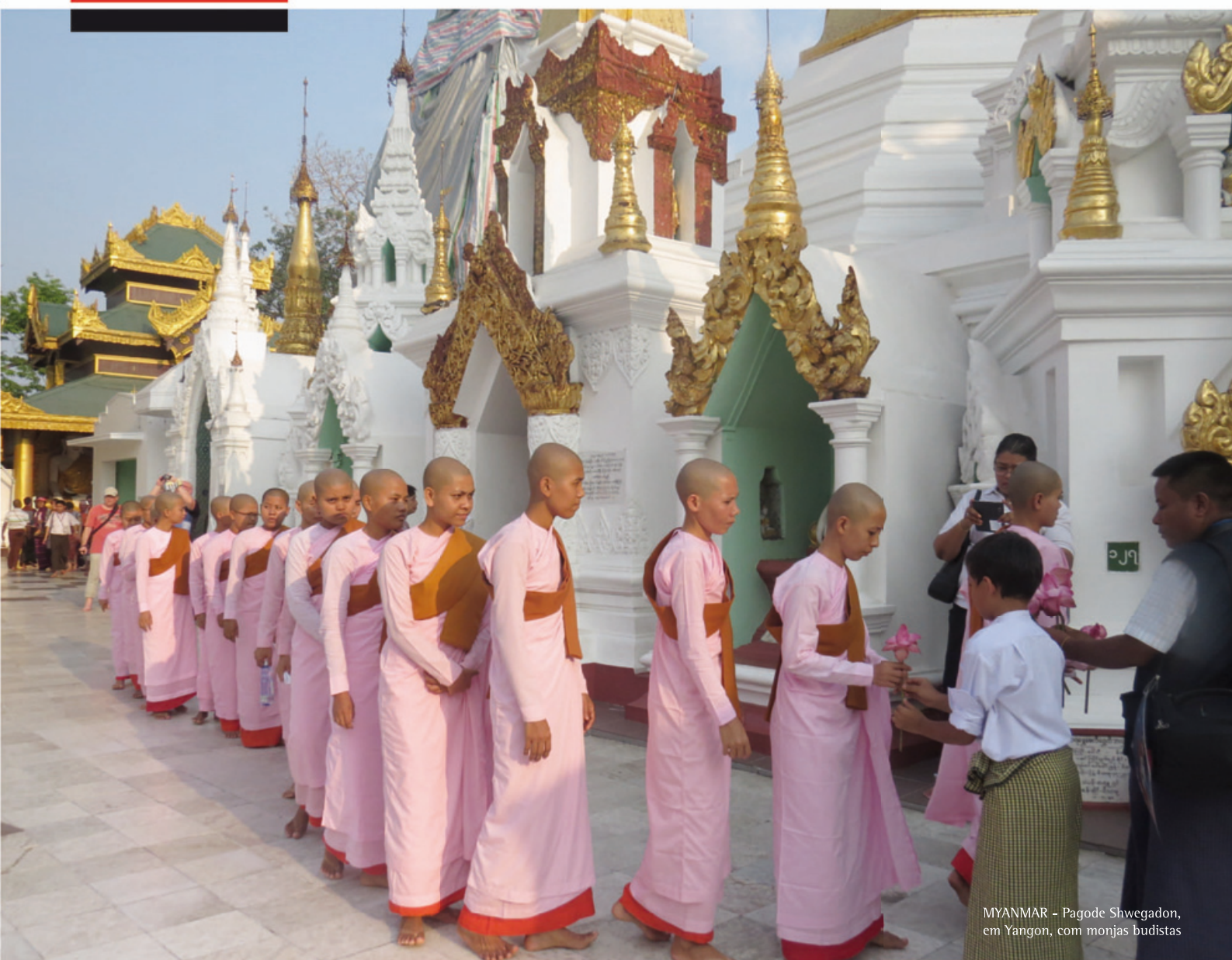
MYANMAR - Pagode Shwegadon, em Yangon, com monjas budistas

Associação dos Antigos Estudantes de Coimbra em Lisboa