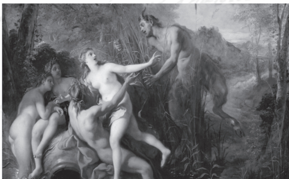
Fig. 2 - Jean François de Troy, “Pã e Siringe” (1722-1724). Los Angeles. Getty Center.