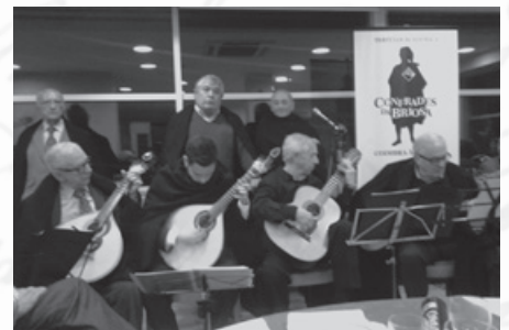
Grupo Serenata de Coimbra-Jantar Briososa

Os novos confrades receberam as insígnias – Babete e Canudo – tendo os pa-