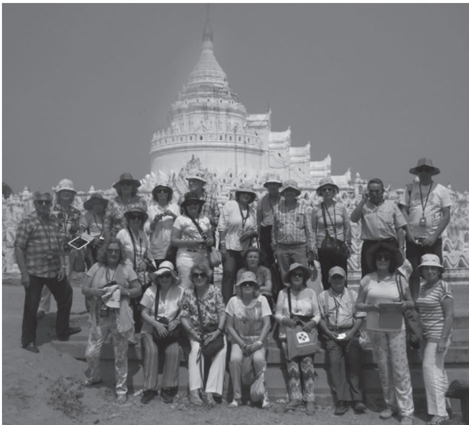
Templo Hsinbyme Paya

onde vivem e estudam mais de 1 000 monges. Alguns enchem potes de água, enquanto as túnicas lavadas secavam ao sol, ritual que é seguido diariamente. Os monges usam vários modelos de túnicas, consoante as ocasiões. Para pregar e recolher a comida a túnica tem que cobrir todo o corpo.