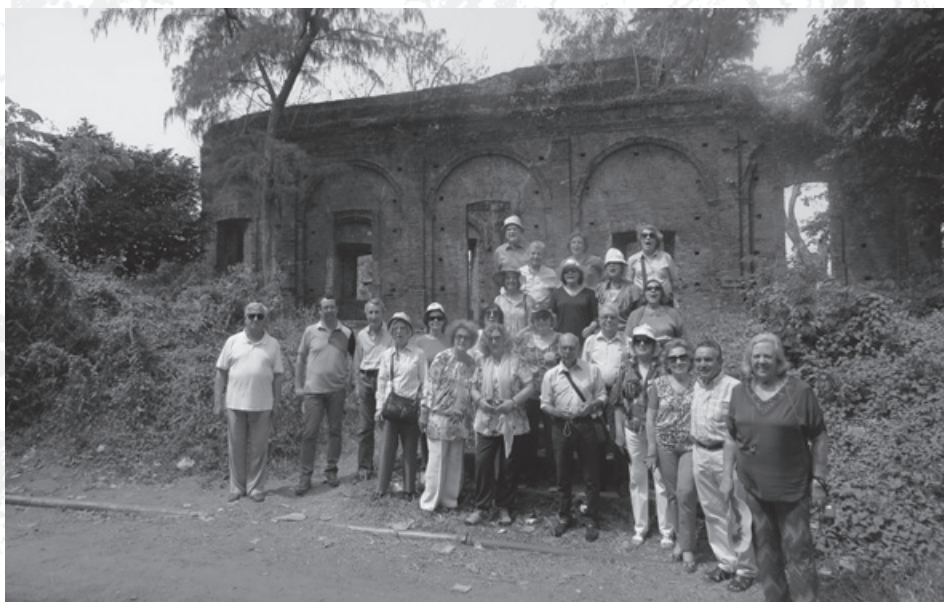
Ruínas da Igreja portuguesa da antiga feitoria do Sião

Seguidamente visitámos o Pagode Phaung Daw U , um dos 3 principais do