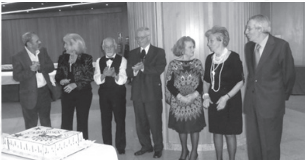
Os Aniversariantes (ludibriados...)

Não há 3 sem 4 – e este ocorreu precisamente no dia 3 de Junho, com 51 associados e amigos a aplaudir o “ Serenata ao Luar ” no seu habitat de eleição: o Coimbra Taberna , onde parece que todos regressam aos verdes anos, num espaço coimbrão por excelência. Parabéns aos aniversariantes e ânimo aos jovens proprietários!