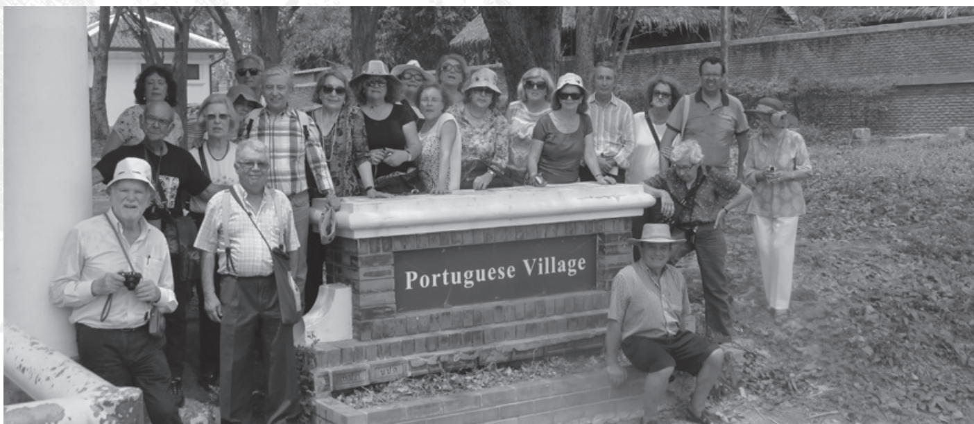
Antiga aldeia portuguesa