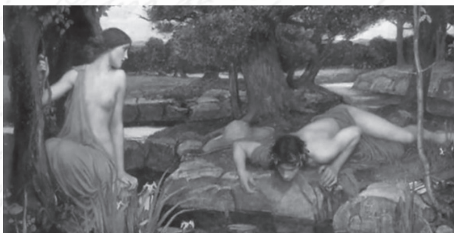
Fig. 1 - J. Waterhouse, “Eco e Narciso” (1903). Liverpool, Walker Art Gallery.

Por acção da deusa Némesis, castigadora da insolência, o próprio Narciso