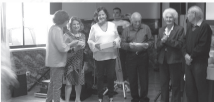
O Júri e os Laureados