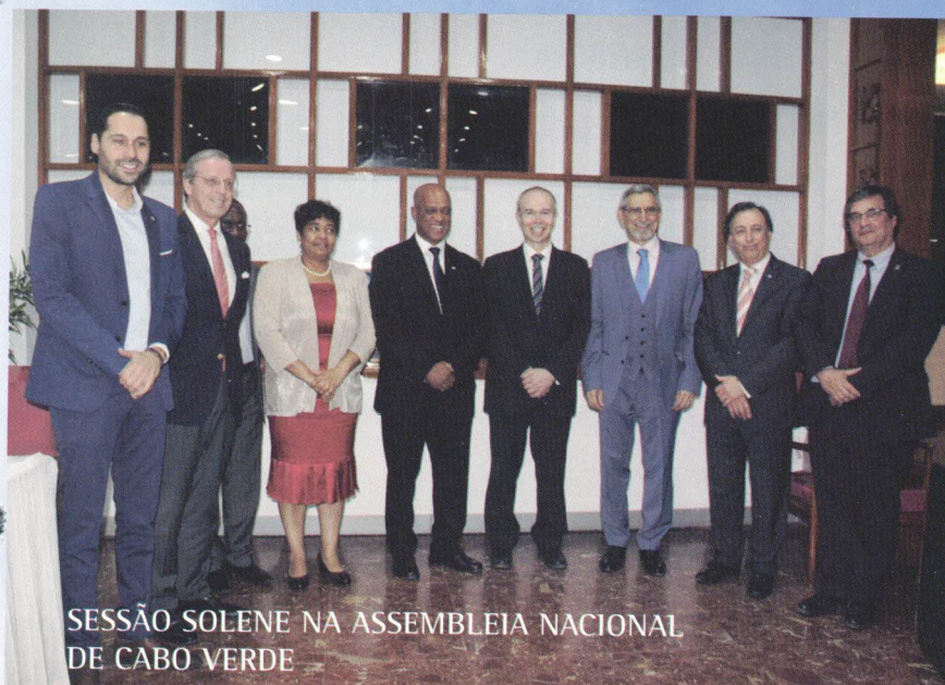
SESSÃO SOLENE NA ASSEMBLEIA NACIONAL DE CABO VERDE