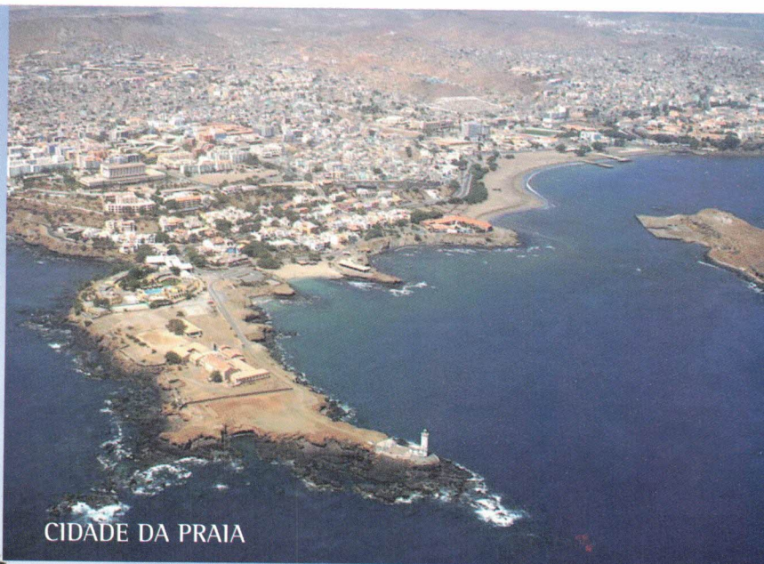
CIDADE DA PRAIA