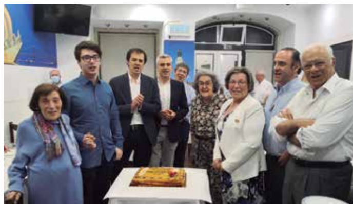
Aniversariantes em Junho

Realizaram-se 2: em Abril e Junho de 2022 na "A Valenciana", com salutar ambiente de boa disposição e, sendo os aniversariantes presentes as estrelas perante um apetitoso bolo. Em ambos, as actuações do Grupo Serenata do Luar (com 4 e 6 elementos, respectivamente) foi um bálsamo para a ansiedade crescente em 2 anos de pandemia e uma bênção para os que lutam por maior confraternização entre gerações.