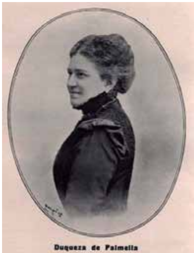
Duquesa de Palmela