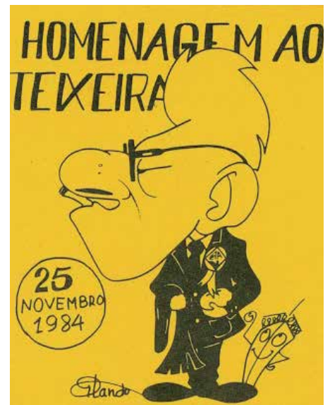
Teixeira, um Senhor respeitado

a pedir satisfações, aquando da crise de 69. E mais se conta que, havendo nos bailes do Casino da Figueira uma menina que só dançava com cavalheiros brasonados, o levaram ao Picalo, onde o trajaram a rigor, antes de o largarem na pista de dança, devidamente industriado; e a coisa resultou tão bem que, a determinada altura, lá vem o Teixeira de braço dado com a menina a caminho do bar e, ao cruzar-se com a maralha: – Ó Tôr, dê-me aí uma coroa pra pagar um pirolito a esta menina!