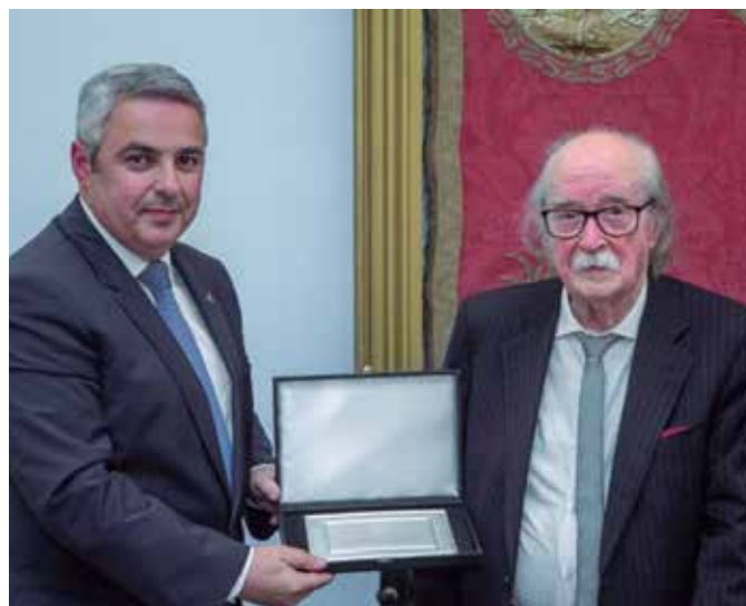
Ilustrações da Câmara Municipal de Ponta Delgada

ce a língua mãe. O seu percurso de vida marcante deve ser reconhecido e divulgado e, por isso, estamos aqui hoje.”