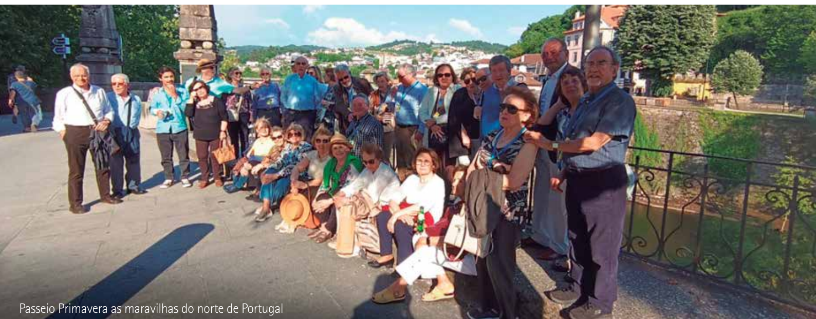
Passeio Primavera as maravilhas do norte de Portugal

Associação dos Antigos Estudantes de Coimbra em Lisboa