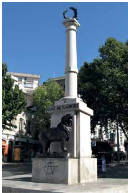
Monumento na Avenida Sá da Bandeira.