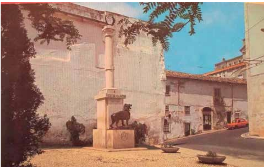
O monumento na Rua do Arco da Traição.

Em 1983 todo o monumento foi, finalmente, reconstruído – por iniciativa da Associação dos Antigos Estudantes de Coimbra e da Câmara Municipal de Coimbra – na Rua do Arco da Traição, num larguinho existente junto da empena Nascente do antigo CADC, hoje Instituto Universitário Justiça e Paz. Mas o local não tinha dignidade suficiente. E em 14 de Setembro de 2005 fez-se a sua transferência para o local onde hoje se encontra, no início da Avenida Sá da Bandeira, com ampla visibilidade para quem sobe do Mercado D. Pedro V.