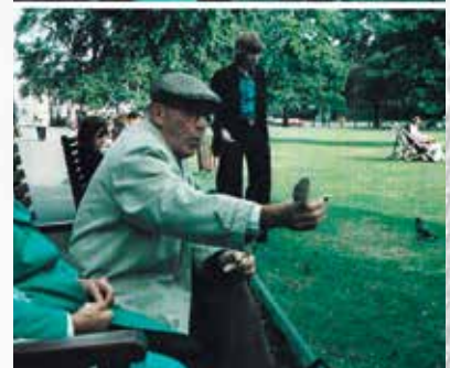
Sr. James Park, Londres - 1975