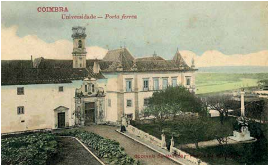
O monumento na Alameda Camões.

Depois do acidente, o conjunto escultórico, com a coluna e o plinto partidos, foi então desmantelado e arrecadado em dependências da Câmara, ao Pátio da Inquisição. Nos anos 50 o leão guardava a entrada do Palácio dos Grilos (sede da AAC depois de demolida a Bastilha), onde, ao que me contaram, estiveram também por algum tempo depositadas algumas das placas de pedra do monumento. Em meados da década de 60, depois de ter entrado em funcionamento a nova sede da AAC, o leão passou para o canto Norte dos jardins da Associação, onde já não tinha a companhia de qualquer outro elemento do monumento original, mas sempre esteve bem acompanhado pelos