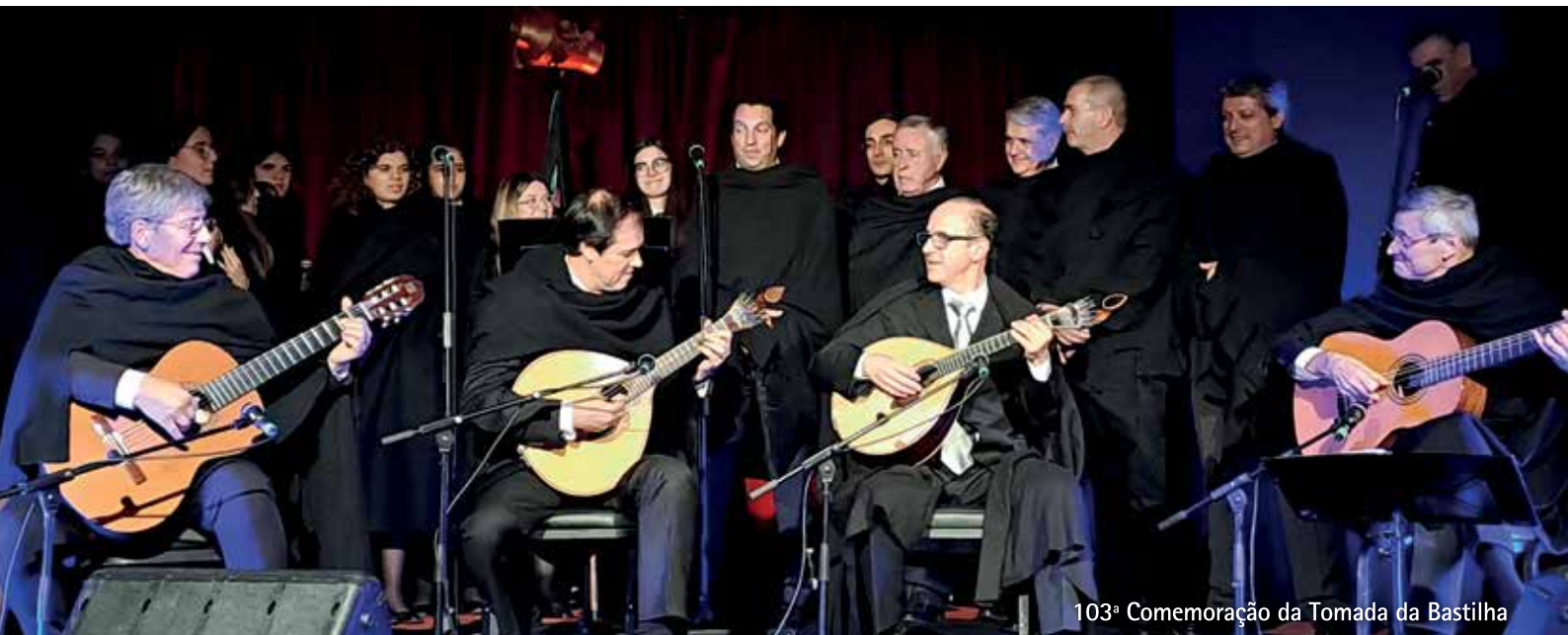
103ª Comemoração da Tomada da Bastilha