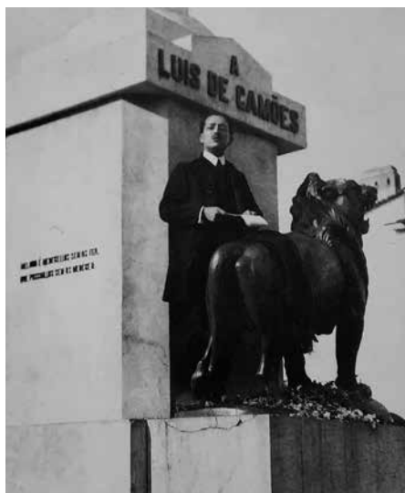
Versos camonianos que estavam no plinto do Monumento. A Velha Alta... Desaparecida

Quanto a contributos de terceiros, apenas encontrei uma explicação credível para o monumento no livro Auroras da Instrução; Pela Iniciativa Particular , 1885, de D. António da Costa. A propósito das festividades do dia 8 de Maio de 1881, escreve o autor «[...] monumento a Camões, coluna de